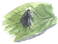
Bokblombeck Stictoleptura scutellata

Svamparna rulljordstjärna och hårig jordstjärna är andra exempel på ovanliga och rödlistade arter som är knutna till sandiga och öppna marker.