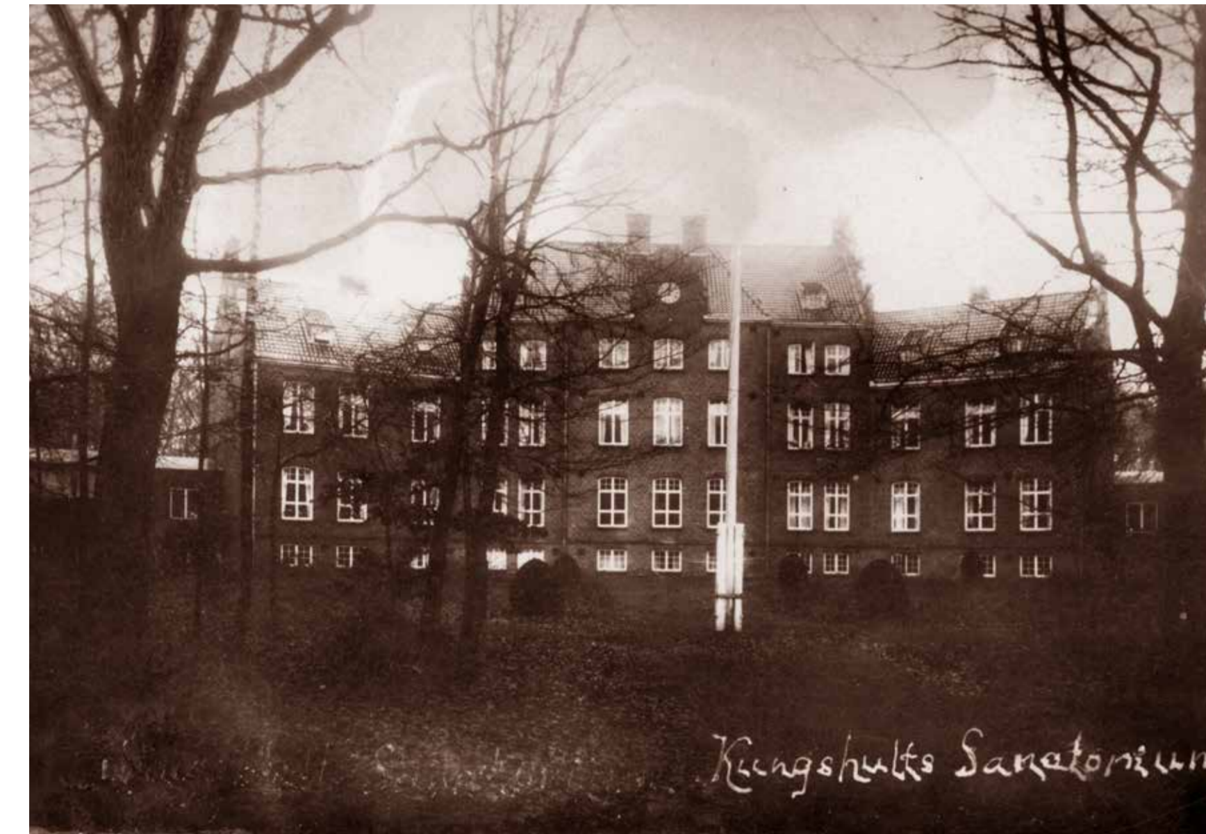
När Kungshults sanatorium byggdes var det viktigt att anläggningen låg utanför staden så att patienterna fick frisk luft.

Kungshultskogen har sedan länge använts för att hjälpa människor att må bättre – både fysiskt och psykiskt. Redan 1910 byggdes Kungshults sanatorium för tuberkulossjuka i skogskanten, så att patienterna skulle få tillgång till frisk luft. Sankta Maria sinnessjukhus blev färdigt 1927 och skogstigarna här intill användes för stärkande promenader.