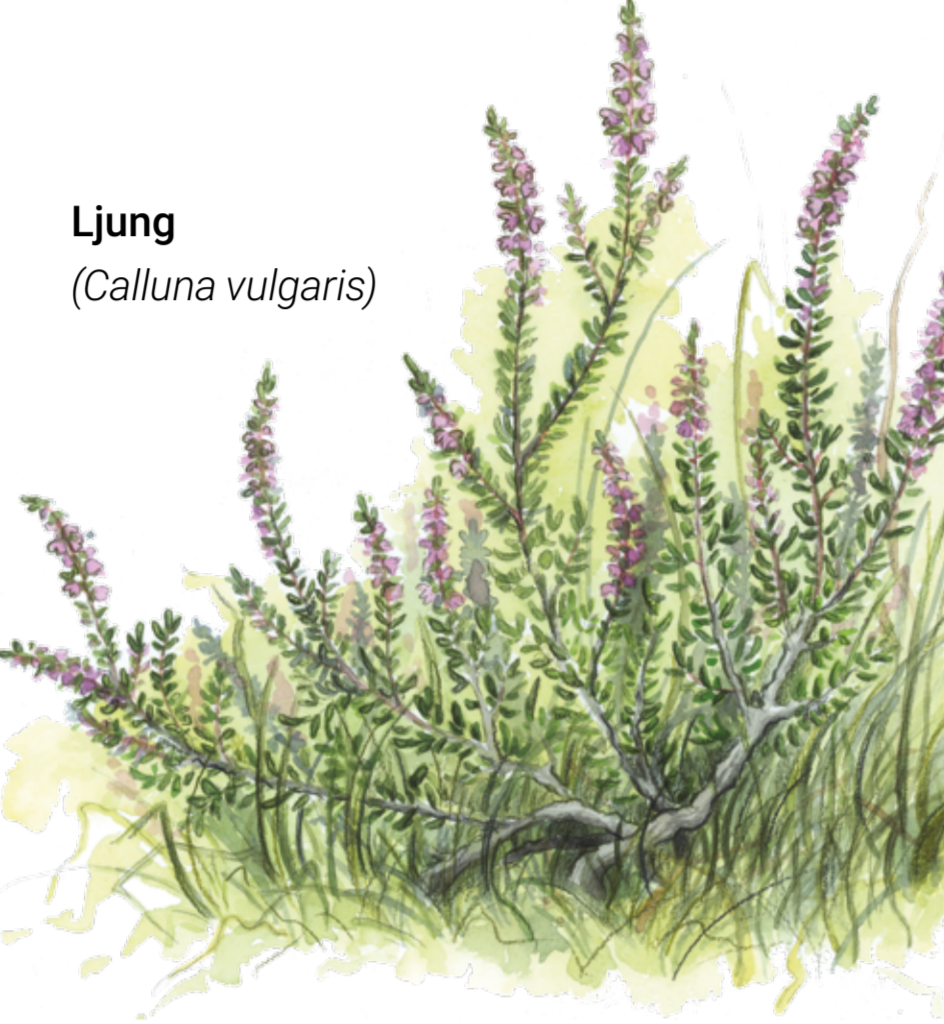
Ljung ( Calluna vulgaris )

I skogen kan man se och höra flera fågelarter. Här häckar kattuggla, ormvråk och ibland korp.