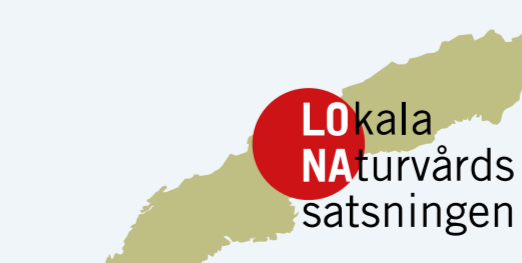
Ställa dig fram om stadsbyggnadsförvaltningen, copyright © Helsingborg stad 2017. Produktion: Infab Kommunikation AB. Illustrationer: Katarina Månsson.

The entire decision with all regulations and the management plan is available here: helsingborg.se/naturreservat