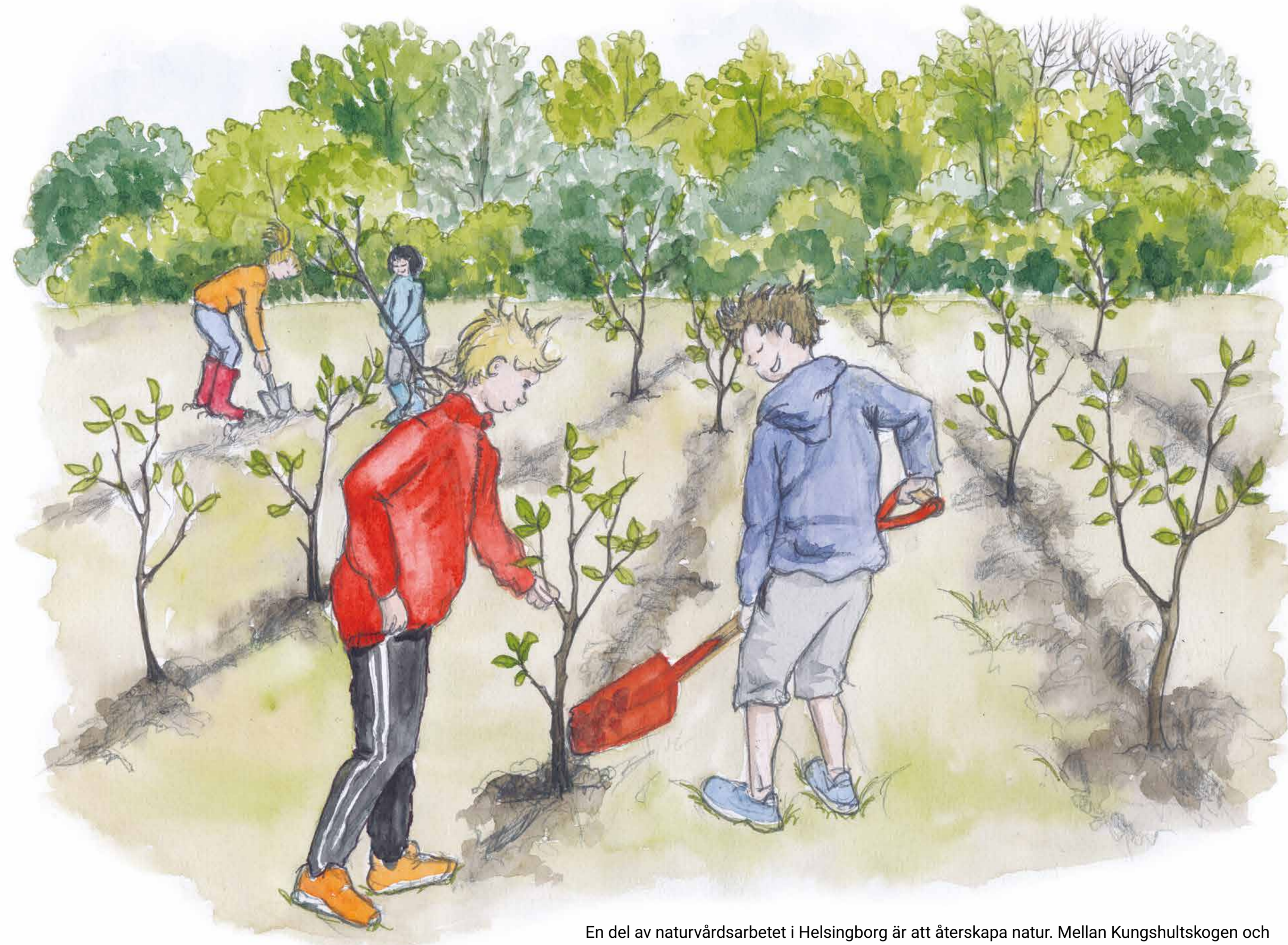
En del av naturvårdsarbetet i Helsingborg är att återskapa natur. Mellan Kungshultskogen och Larödskogen kommer barn att plantera ny skog under flera år genom projektet Barnens skog.