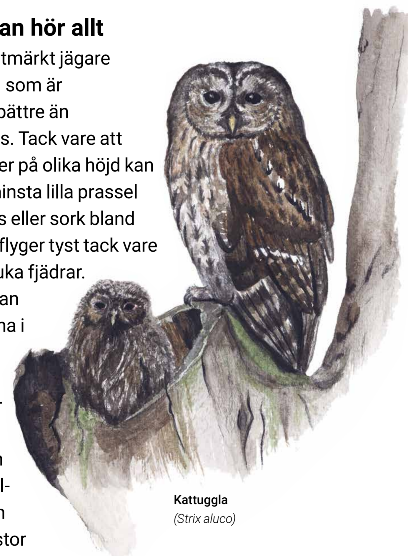
Kattuggla ( Strix aluco )

Dess nattliga vanor och spöklika, lätthämade rop har lett till att den i folketro förknippas med otur och död.