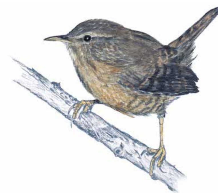
Gärdsmygg ( Troglodytes troglodytes ) En av småfågeln som häckar i Kungshultskogen. Den har en kraftfull sång trots den lilla storleken. Den tycker om täta buskage där den bygger bo och lägger sina ägg.

Målet är att binda samman Kungshultskogen med Larödskogen och Soferoskogen. Då får vi människor större ytor att röra oss på samtidigt som djur och växter får bättre livsförutsättningar.