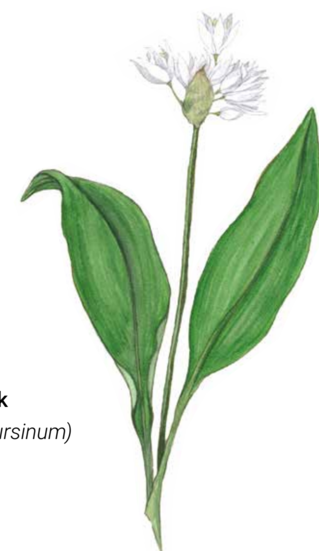
Ramslök ( Allium ursinum )