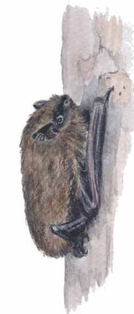
Dvärgfladdermus ( Pipistrellus pygmaeus ) Den är vår minsta fladdermus och väger endast cirka åtta gram och har en kroppslängd på cirka fem centimeter.