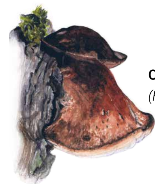
Oxtungsvamp ( Fistulina hepatica )

Skötsel av träden är inriktad på att få dem att bli så gamla som möjligt genom frihugning vilket innebär att ungråd av björk och bok som sticker in i ekarnas kronor och stjäl solljuset huggs bort. Görs inte detta dör de ljusälskande gamla träden i förtid.