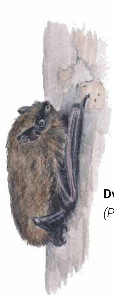
Dvärgfladdermus ( Pipistrellus pygmaeus )

Exempel på arter som lever på de gamla ekarna i Pålsjö skog är den mörkröda oxtungsvampen som växer på gamla stammar, dvärgfladdermus som bor i håligheter i träden och större hackspett som hackar ut och äter insekter ur stammen.