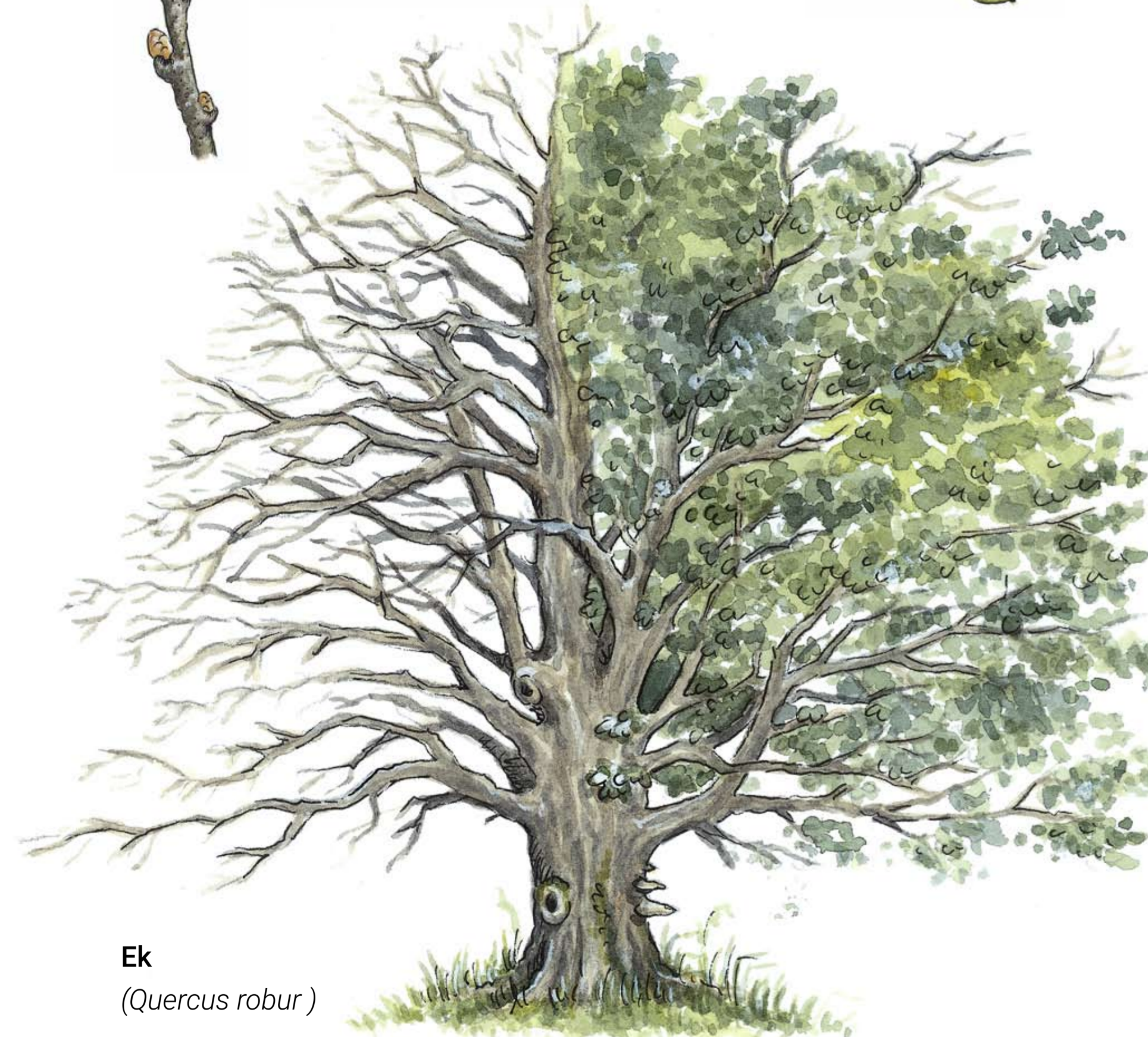
Ek ( Quercus robur )

Eken utsågs till Helsingborgs stadsträd efter en omröstning 2016 där helsingborgarna fick välja sitt favoritträd. Här i landborgskanten växer eken naturligt och trivs bra i de solbelysta slutningarna.