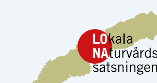
Stalliga bidrag inom lokala naturvårds-satsningen medfinansierar genomförandet av detta projekt.

The entire decision with all regulations and the management plan is available here: helsingborg.se/naturreservat