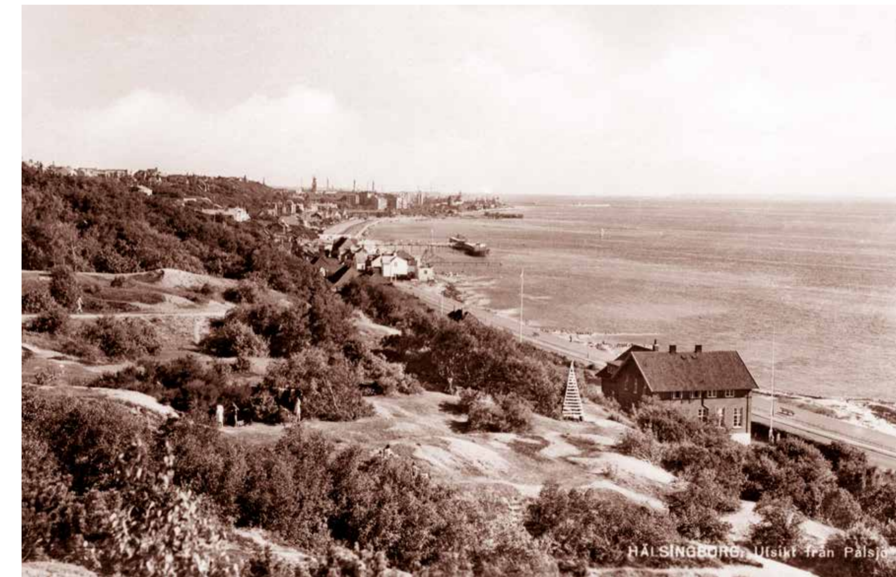
Epitetet "Sundetets pärla" är från 1900-talets början och har stark koppling till vyerna över sundet från landborgen.

Njut av utsikten medan du promenerar längs stigarna på landborgen.