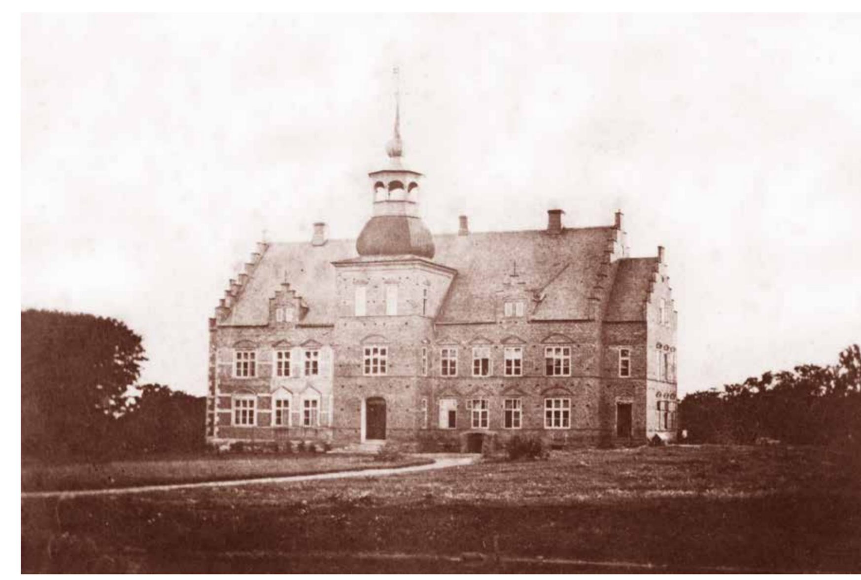
Pålsjö slott på ett fotografi där kupolen syns. 1873 byggdes tornet om till nuvarande trappstegsgavel.

Slottet nämndes i skriftliga dokument första gången 1491 och var då en gård som hette Pawelsköb. Sedan dess har gården genomgått många förändringar och fick först i slutet av 1800-talet sitt nuvarande utseende.