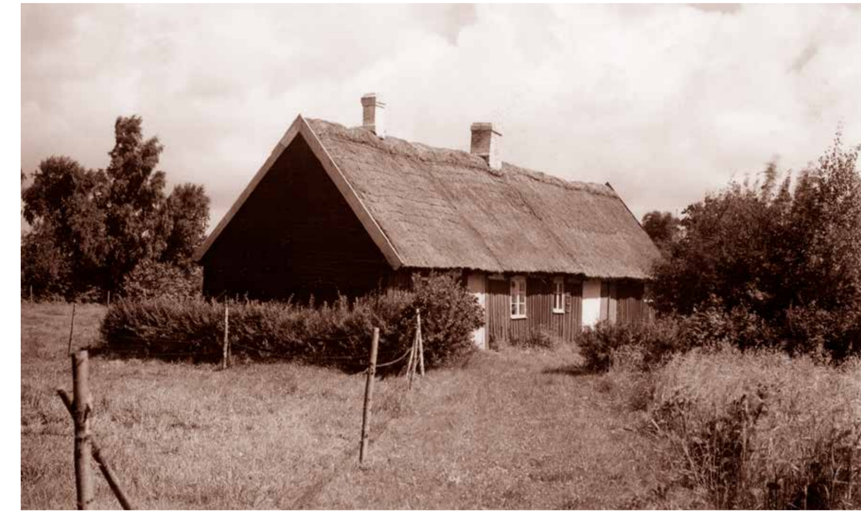
I mitten av 1800-talet fanns det omkring 100 000 torp i Sverige. De flesta av dem har förfallit eller rivits efterhand. Detta är det sista i Helsingborg och byggdes 1936. Bilden är från 1940-talet.

Det har funnits fem torp till i betesmarken. Dessa revs på 1940- och 1950-talet men fortfarande kan man se sten-grunder och buskar som hörde till trädgårdarna.