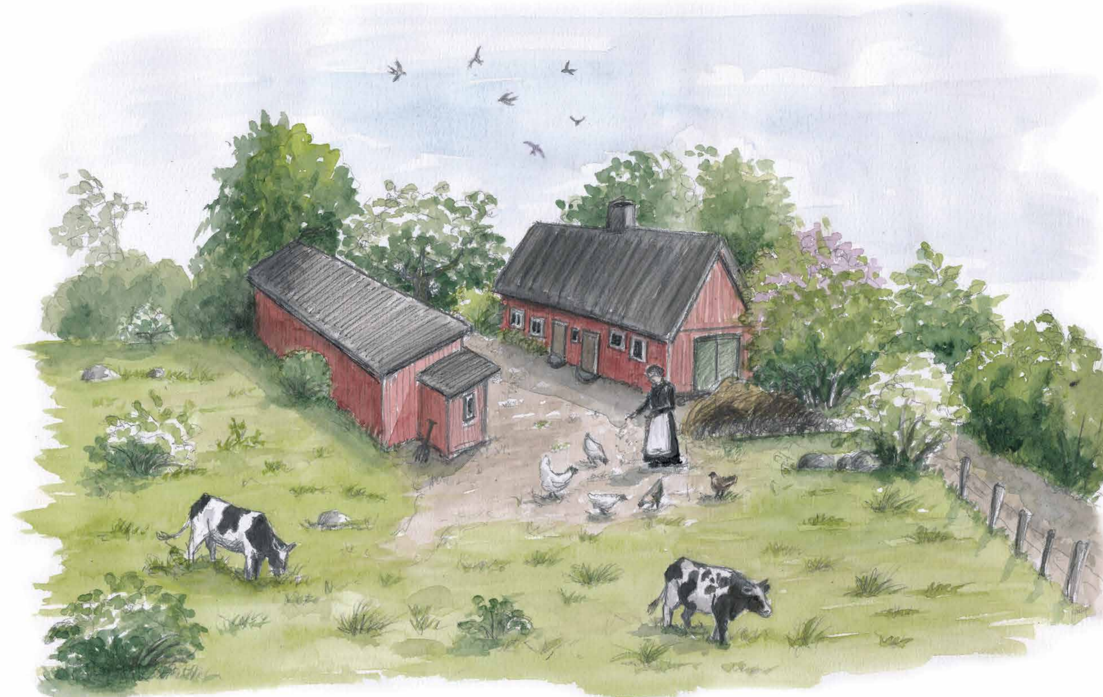
Torporen hyrde en bit jordbruksmark och ibland även ett mindre hus – torpet. Hyran betalades ofta genom att man fick arbeta på gården som ägde marken, så kallade dagsverken.