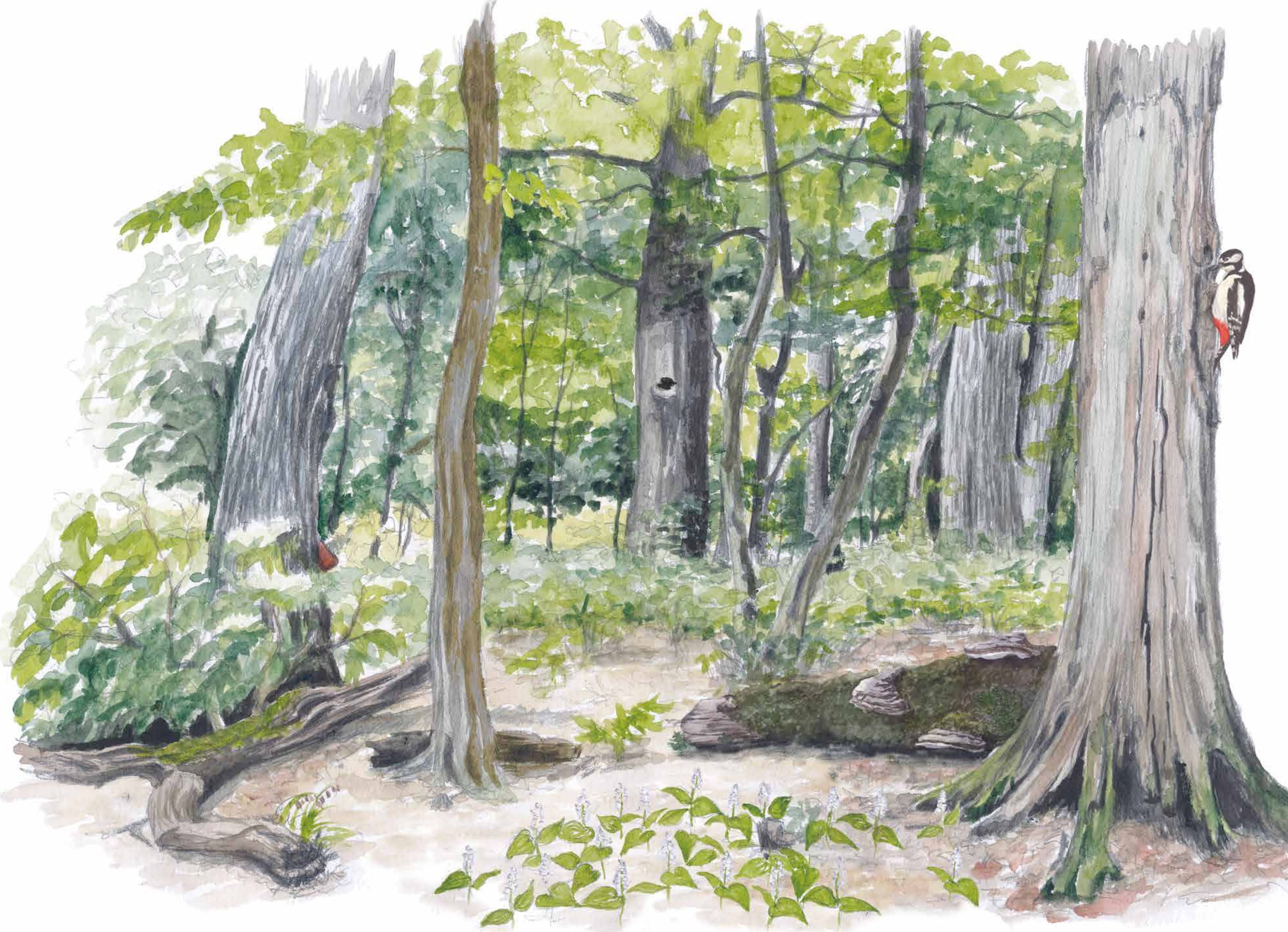
I en skog med gamla, grova träd och död ved trivs ovanliga och rödlistade djur, växter och svampar allra bäst. Det som vi kanske tycker ser dött och skräpigt ut är i själva verket bostad och mat för andra.

Dvärgfladdermus ( Pipistrellus pygmaeus ) Den kanske vanligaste av de sju fladdermusarter som finns i Pålsjö skog. Den är vår minsta fladdermus och väger cirka åtta gram med en kroppslängd på cirka fem centimeter.