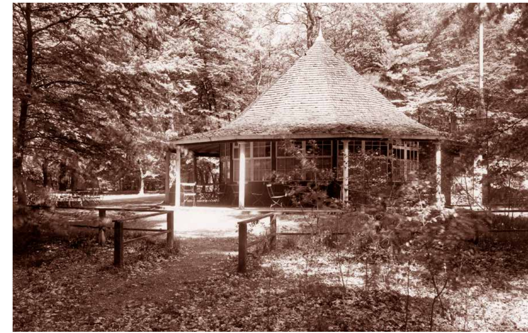
Skogspaviljongen med kaffeservering öppnade 1914. Den runda paviljongen är ritad av Sigurd Lewerentz, en av Sveriges mest kända arkitekter. Han har bland annat ritat Skogskyrkogården i Stockholm som är ett världsarv.

I Pålsjö skog har besökare njutit av naturen i mer än hundra år. Redan 1908 köpte staden in marken av konsul Persson. 2016 beslutade Helsingborgs kommunfullmäktige att skydda Pålsjö skog med omnejd som naturreservat, så att vi och framtida besökare kan få fortsätta att njuta av den fina naturen här.