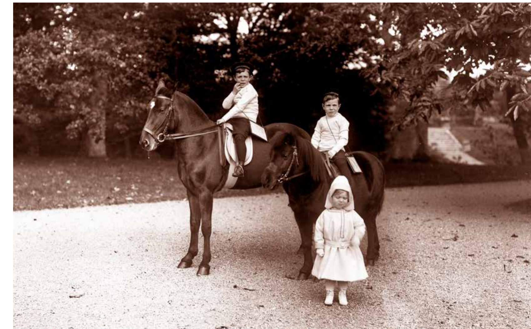
Prinsarna Gustav Adolf och Sigvard på en ridtur med prinsessan Ingrid bredvid. Året var 1917.

Det började med att kronprinsparet Oscar och Sophia förälskade sig i platsen vid landborgen med utsikt mot Danmark och den skogklädda ravinen ner mot Öresund. De köpte in gården Skabelycke och lät bygga ett kungligt sommarslott som blev färdigt 1866.