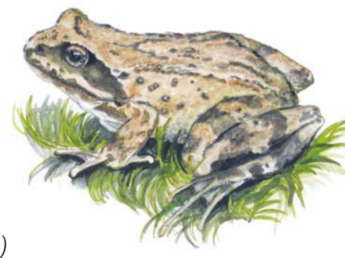
Vanlig groda (Rana temporaria)