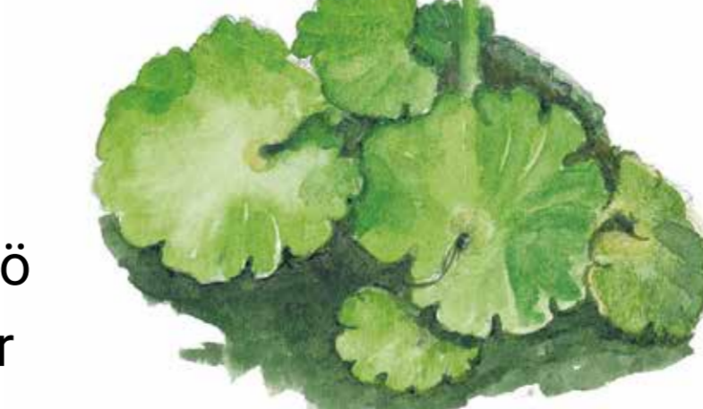
Gullpudra är en fin liten blomma som trivs i äldre skog med fuktig mark.