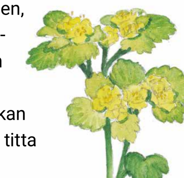
Gullpudra (Chrysosplenium alternifolium)

En ny våtmark har byggts öster om skogen. Den fungerar som ett naturligt reningsverk för näringsrikt vatten från åkrarnas dräneringsrör. På så sätt minskar vi övergödningen i Öresund och samtidigt får vi en fin livsmiljö för fåglar, grodor och sländor i dammen!