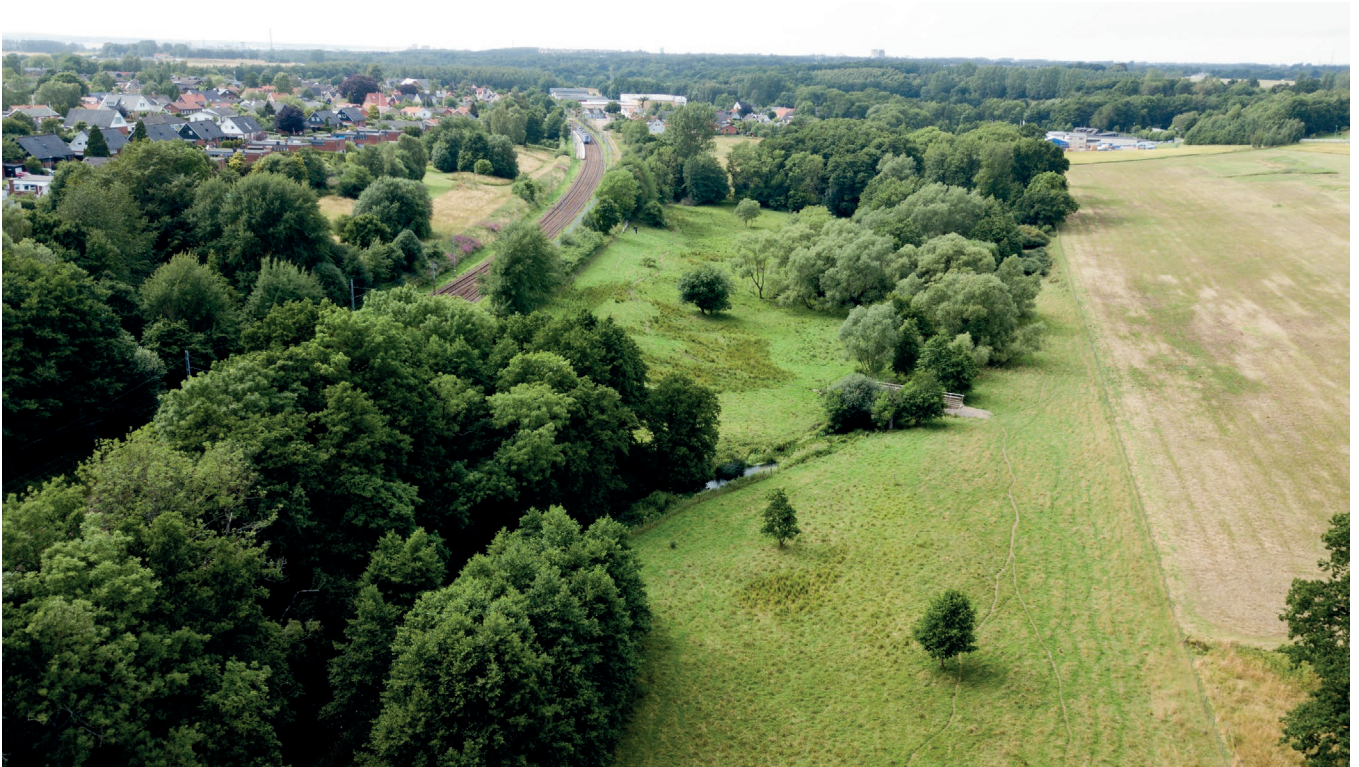
Handlingsplan för gröstrukturen – genomförda åtgärder i Gantofta naturreservat.