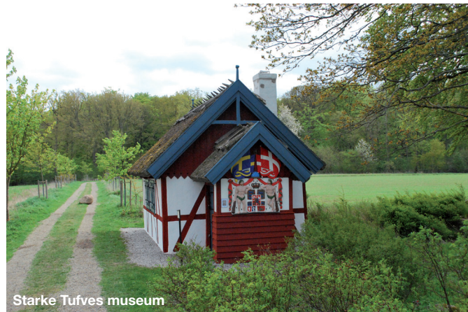
Starke Tufves museum

I Duvestubbe skog är du välkommen att njuta av naturen och de historiska spåren. Här finns möjlighet att promenera på iordninggjorda stigar, grilla vid eldplatserna eller bara sitta ned och pausa på en bänk. Det finns markerade promenadstigar för att ta sig runt i skogen.