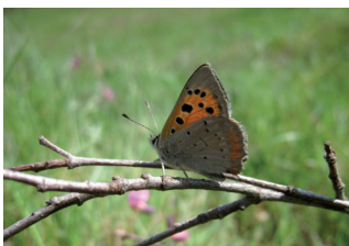
Mindre guldvinge Lycaena phlaeas