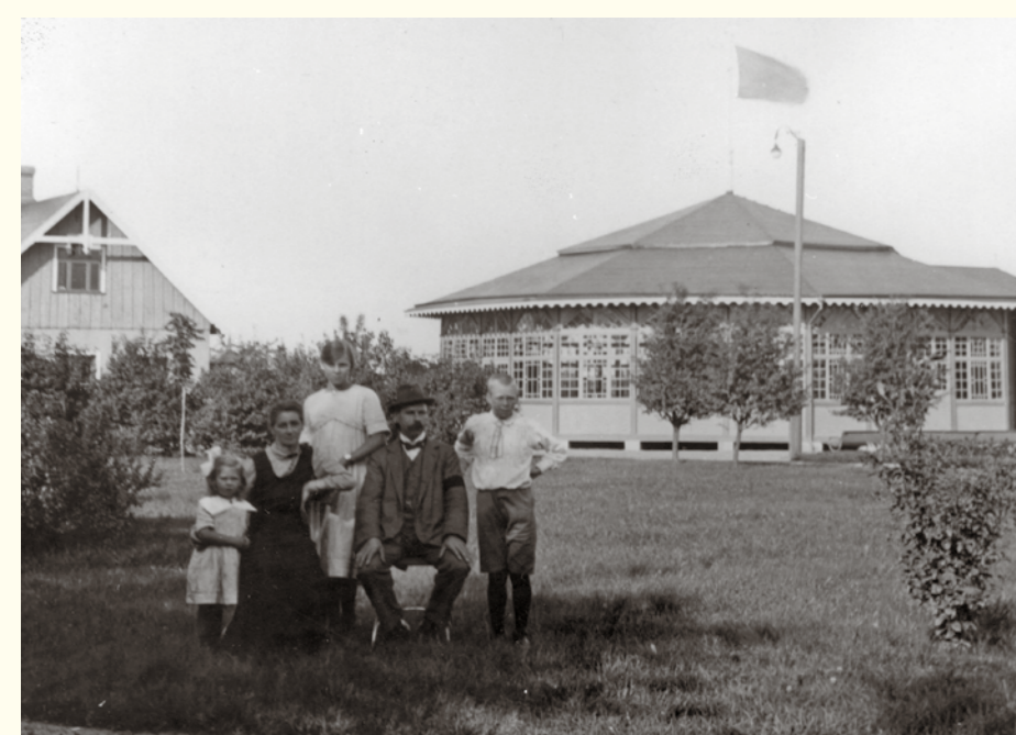
9 Folkets park i Hasslarp på 1910-talet.