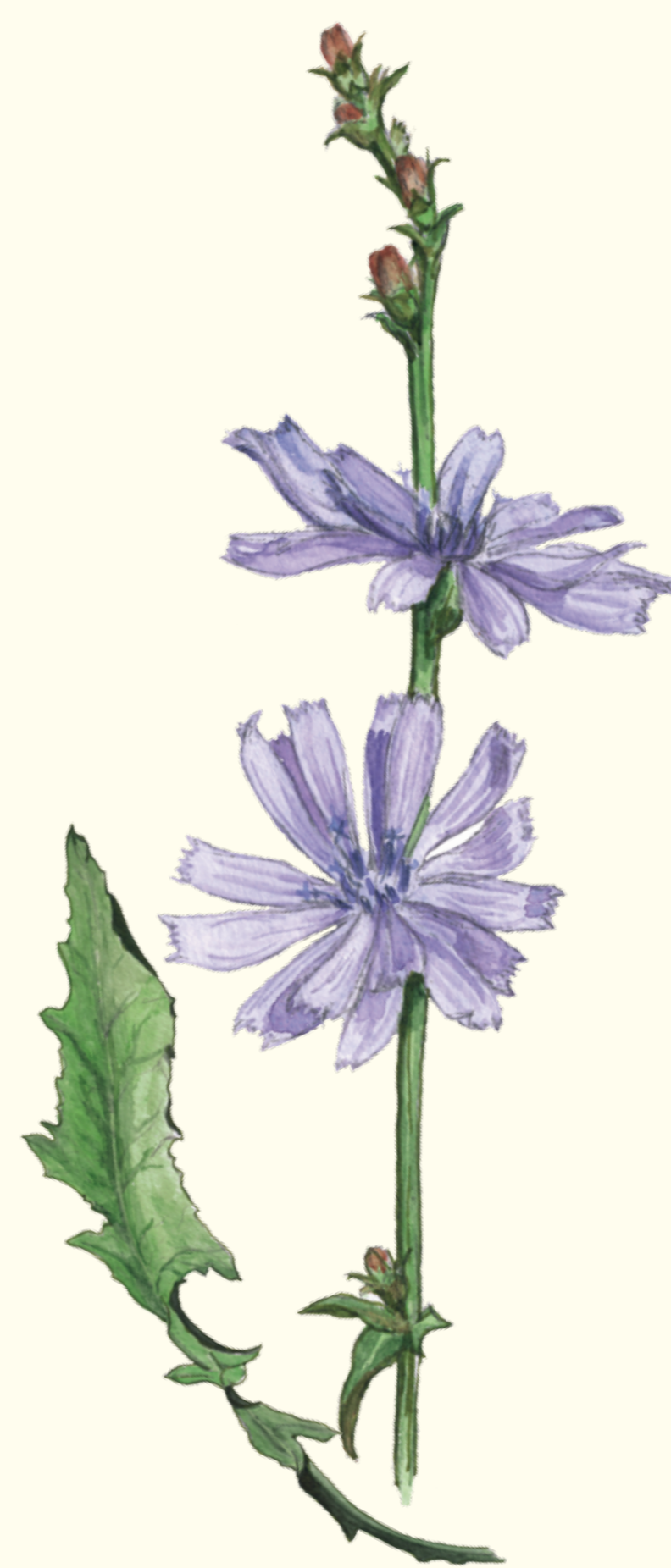
Cikorior - åkerkantens okrönte drottning.