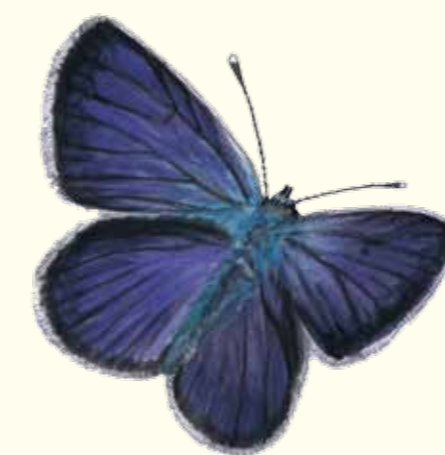
Ängsblåvinge är en av många fjärilsarter i Äppelskogen.