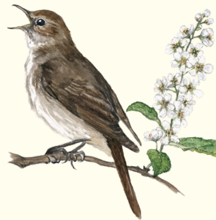
På försommaren hörs näktergalens exotiska toner från Kattarps mosses täta busksnår.

Ibland kan gräset vara lite högt i åkerkanterna och om det har regnat mycket kan det bitvis vara lerigt, så ta på rejäla skor. Var extra uppmärksam när slingorna korsar större vägar och obebakade järnvägsövergångar.