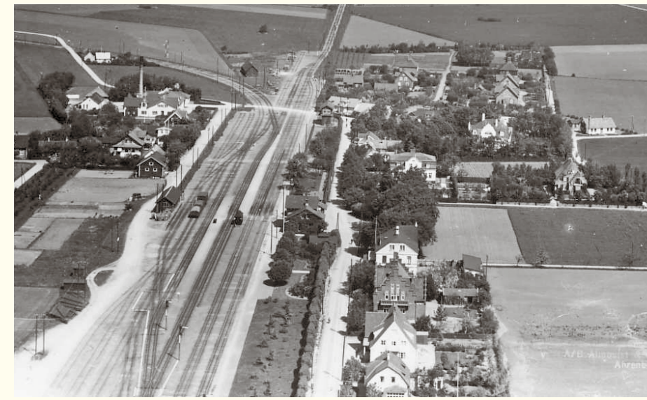
Flygfoto över Kattarps järnvägssamhälle, år 1936. Uppe till vänster syns mejeriet och järnvägen mot Höganäs. Centralt i bilden ligger stationshuset med järnväghotell och bank snett över Rallaregatan. SJ-bostäderna skymtar i bakgrunden.