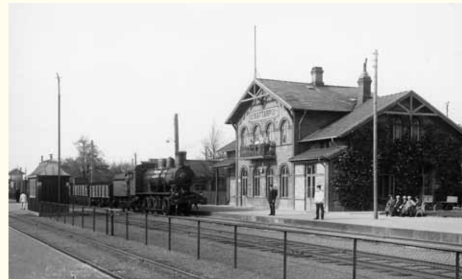
1 Kattarps stationshus år 1928. Byggnaden revs 1984.