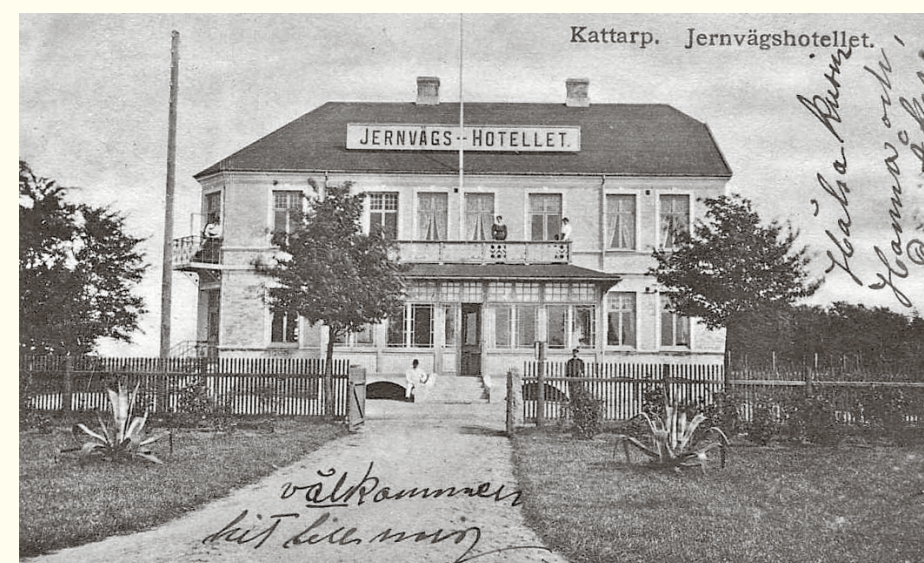
1 Kattarps järnväghotell, byggt 1905.