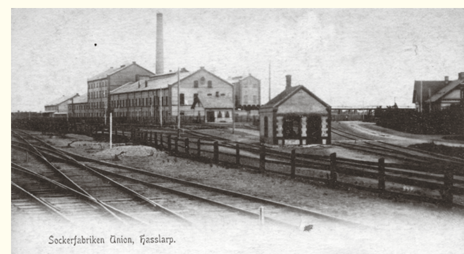
10 Hasslarps sockerbruk, omkring år 1900.

Välkommen till natur- och kulturslingorna i Kattarp och Hasslarp. Vandrigen går genom ett bördigt jordbrukslandskap på grusvägar, i åkerkanter och på stigar i lövskog. Slingorna har alltid någon av de två byarna som utgångspunkt. Kattarp, gammal kyrkby och järnvägsknut eller Hasslarp, före detta brukssamhälle med ståtliga Folkets park.