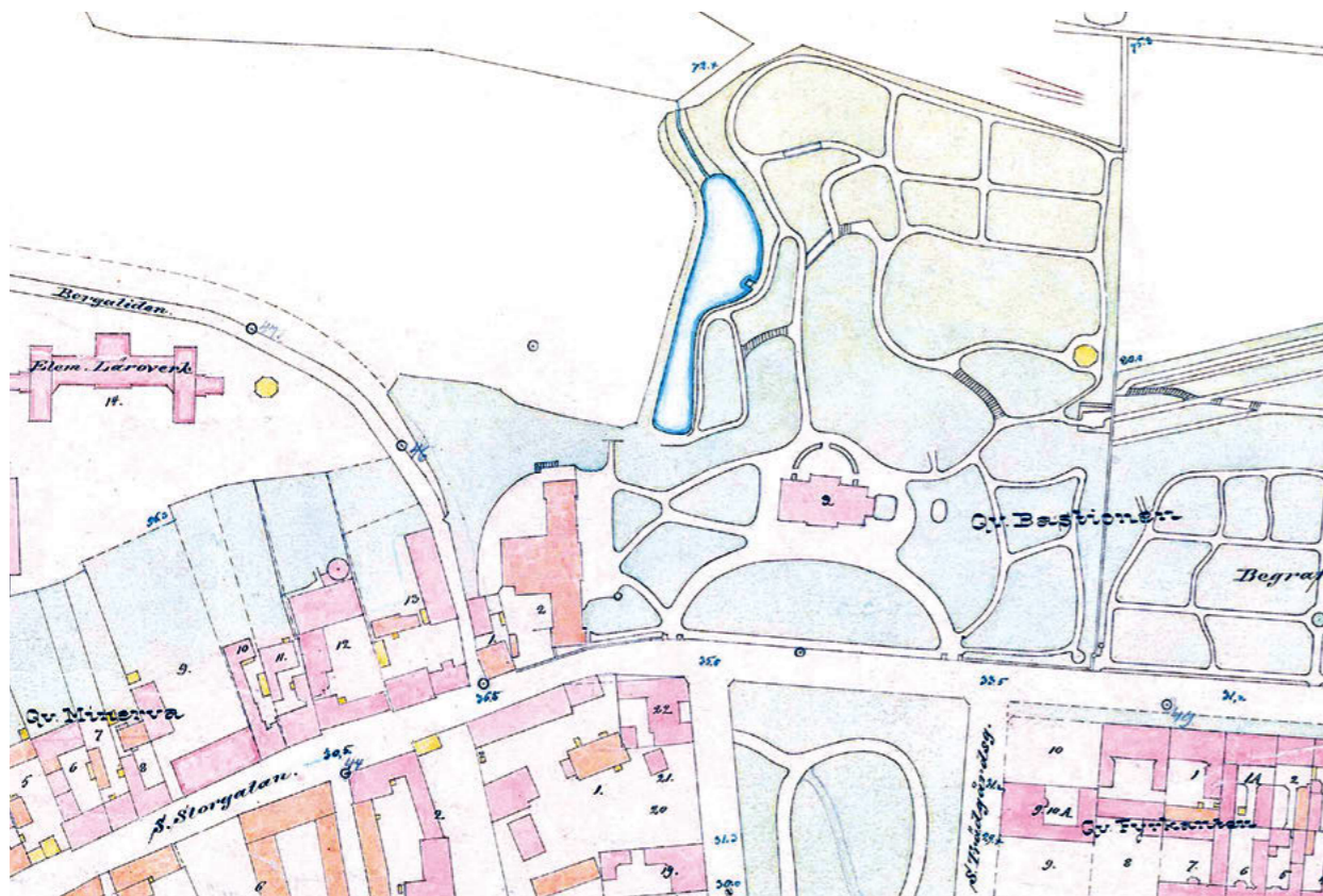
Kartan är upprättad 1880 och stämmer troligen ganska väl överens med parkens ursprungliga planering. Parken fick ringlande gångar enligt romantisk stil med mer formella strukturer närmast villan. Uppe på landborgen invid gränsen till begravningsplatsen fanns en paviljong i två våningar. Norr till vänster i bild. Ritning: Helsingborgs stadsarkiv.