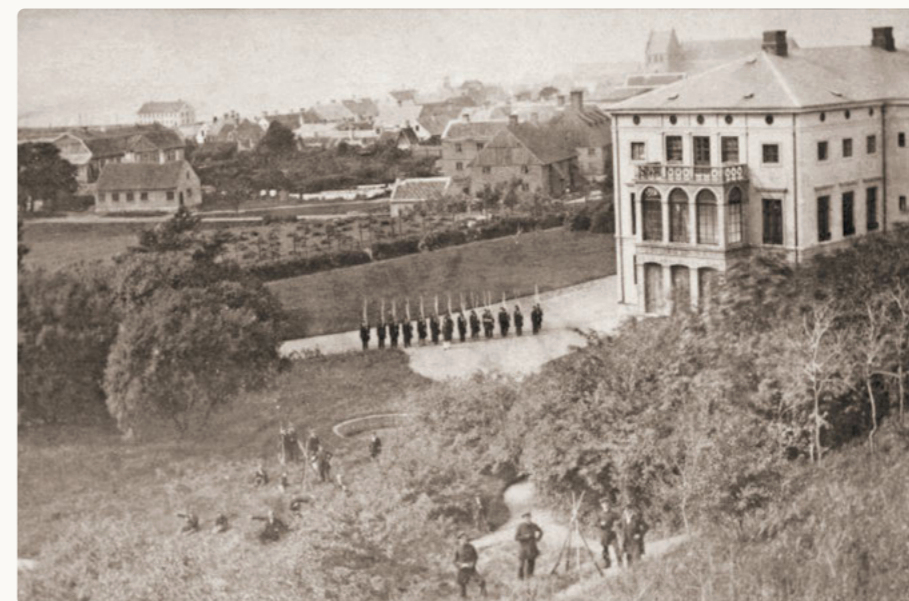
Bilden visar en grupp militärer i parken söder om villan. Åren 1863–1883 var villan befälsbostad åt det södra militärdistriktet. Nere i gräsmattan skymtar en liten fontändamm.