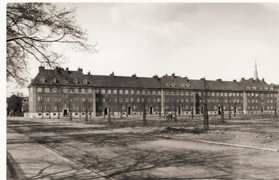
Fotografiet från 1927 visar rader av nyplanterade lundalmar i det som skulle bli Furutorpsplatsen. I förgrunden Bryggaregatan och i fonden syns det så kallade Miljonhuset i kvarteret Amerika Södra.

Furutorpsplatsen är en områdespark och en av området Söders värdefulla gröna oaser. Parken började anläggas år 1925 och var till att börja med en prydnadspark men har under årens lopp förändrats efter tidens ideal. Här finns stora öppna ytor men också små hemtrevliga parkrum. Med inslag som lekplatser, utegym och grillplats erbjuder parken en mängd funktioner inom lek och rekreation.