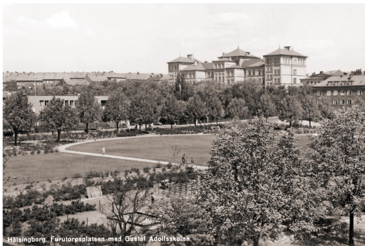
Vykortet är troligen från sent 1940-tal och är taget mot nordöst, med vy över den nyligen omgjorda Furutorpsplatsen.

Problem med plaskdammens vattenrening ledde till att den lades igen till förmån för sandlek, grillplats och odlingsland. I väster modularades landskapet med vallar och kullar som försågs med linbana, balansstockar, en rutschbana och en hängbro. Vid samma tid tillkom en enplansbyggnad för inomhusaktiviteter.