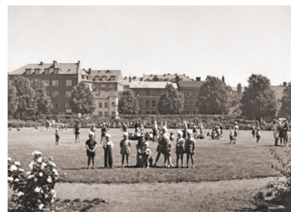
Furutorpsplatsen i slutet av 1940-talet. Den svängda pergolan av ekstockar syns i bakgrunden.