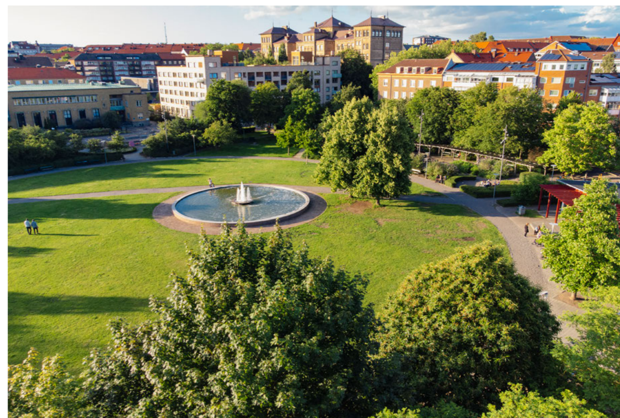
Furutorpsplatsen består av ett stort öppet gräsfält med blandade planteringar runtom. Mitt i gräsmattan ligger en fontändamm från 2004.

På senare tid har även den upptrampade gången över gräsfältet permanentats.