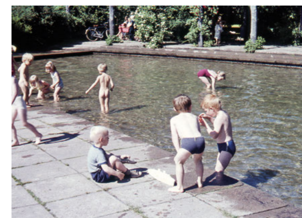
Plaskdammen låg invid pergolan och var ett av många inslag i parken som genom åren tillägnats barnen i området.