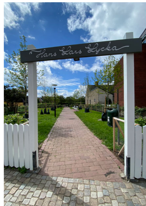
Det röda markteget och den enkla trädportalen med parkens namn tillkom 1957. Belysningen i parken är från upprustningen år 2024.

Efter 1930-talet har parken genomgått flera förändringar, både i form och material. År 1957 fick entréerna och gränserna mot Rååvägen och Missionsgatan sina nuvarande utföranden