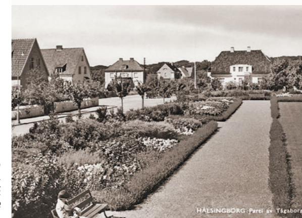
HÄLSINGBORG - Park av Tågaborg

Bevarandeprogram för Västra Tågaborg (1995): Parken är utpekad som en värdefull platsbildning och beskrivs vara av särskild betydelse för stadsbilden.