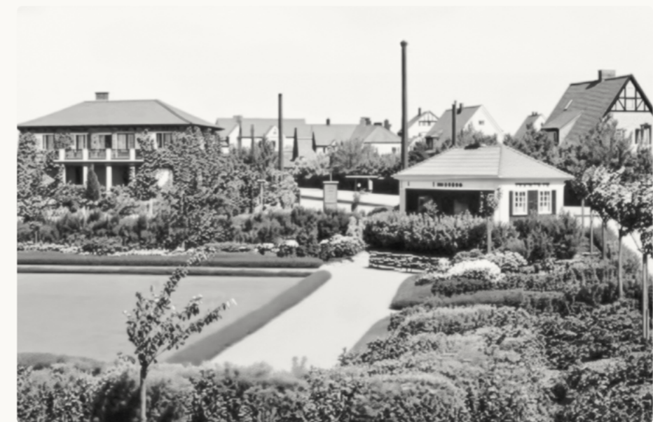
Pilvångsplatsen med kiosk i sydöstra hörnet, utmed spårvägen.

Pilvångsplatsen är en mindre kvarterspark och en av Tågaborgs värdefulla gröna oaser. Parken, som har sitt ursprung i 1930-talet, karakteriseras av symmetriska planteringar bestående av rader av körsbärsträd samt bokhäckar och murgröna. På våren blommar mängder av lökväxter i parken. Parken används främst av de boende i området som en plats för avkoppling och lek.