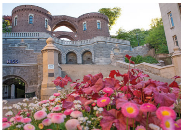
Från Stortorget leder de monumentala Terrasstrapporna upp i parken. De uppfördes inför 1903 års utställning i granit och tegel.