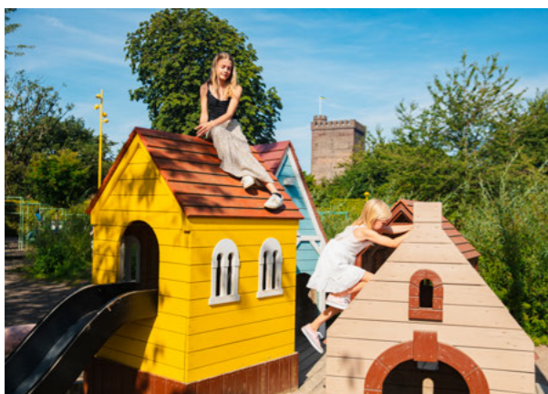
Slottshagens sydöstra hörn upptas av en stor temalekplats, Medeltidslekan, omgärdad av höga bokhäckar.