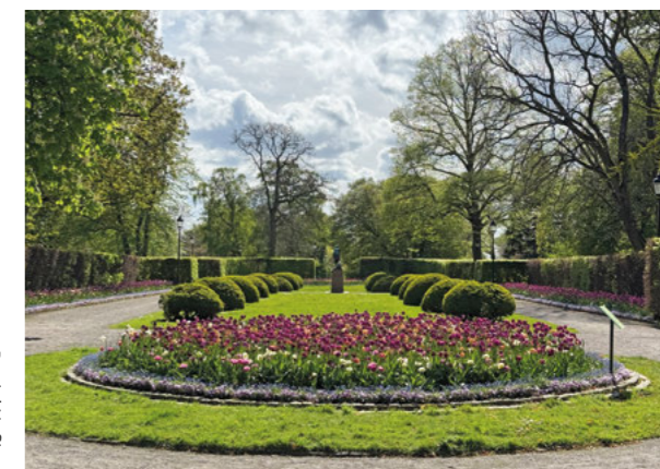
Den symmetriskt uppbyggda blomstergatan, omgärdad av bokhäckar och försedd med halvklot av buxbom.

På några platser inom parken har man i senare tid använt marksten för att på ett pedagogiskt sätt markera var de medeltida byggnadsverken ringmuren, S:t Mikael's kapell och ett av anläggningens murtorn var belägna.