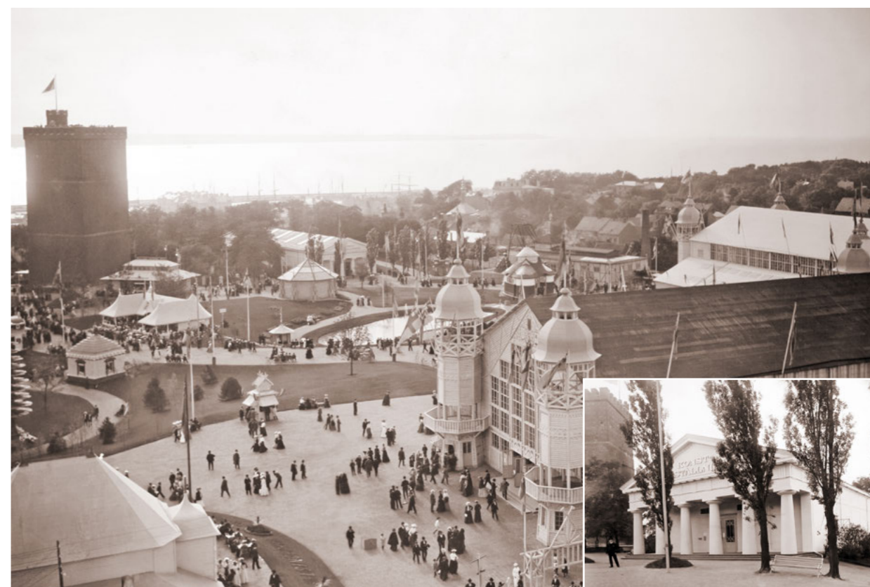
Slottshagen under den välbesökta industri- och slöjdställningen 1903. Norr om Kärnan skimtar Konsthallen (även infälld bild) som fick vara kvar i Slottshagen till 1930-talet då även de privata trädgårdarna bakom byggnaden införlivades i parken. Foton: Helsingborgs museum.

Ritning över Slottshagen, sannolikt upprättad av Oskar H Landsberg, kring 1920. Parken är formad enligt engelskt stilideal och karakteriseras av öppna gräsytor med tätare vegetation i det slingrande vägsystemets korsningar. Ritningen visar att huvuddelen av dåvarande offentlig park var belägen öster om Slottshagsgatan medan merparten av ytorna i väster upptogs av privata tomter. Norr om Kärnan ligger Konsthallen från 1903 (riven 1937) och i söder ligger villa Skalet från 1884 (riven 1983). Skalets trädgård ritades av trädgårdsmästaren Theodor Wieck. Norr till höger i bild enligt pilen. Ritning från omkring 1920, Helsingborgs stadsarkiv.