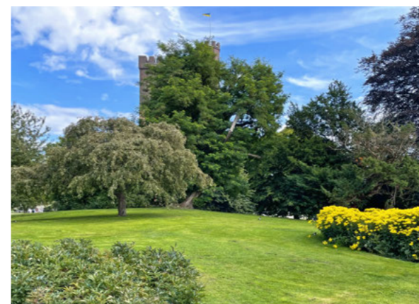
Slottshagen präglas av det engelska stilidealet. De forna vallgravarna bidrar till det svagt kuperade landskapet. Utmärkande för området norr om Kärnan är även de stora perennplanteringarna av pion (vänster) respektive parkstånds (höger).

Mellan åren 2018 och 2025 har träplank och trästaket bytts ut mot svartmålad järnstaket, framför allt i västra och nordvästra delen av parken.