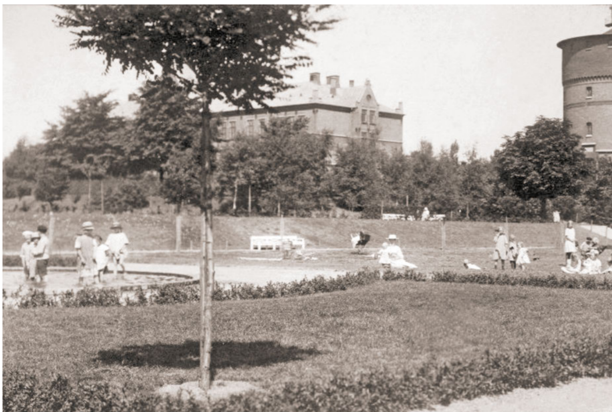
Bilden visar Slottshagens lekplats, anlagd 1920. Till vänster vadar barnen i den runda plaskdammen. Lekplatsen ligger på samma plats än i dag men har omgestaltats flera gånger. Nelly Gunnarsson, tidigt 1920-tal, Helsingborgs museer.

Redan 1906 anlades en liten lekplan uppe på en platå invid Bergaliden. År 1920 revs tennishallen som legat kvar sedan 1903 och på dess plats, i parkens sydöstra hörn, anlades en stor lekplats med "plaskdamm, gräsplan och grushög". Denna lekplats har förnyats i omgångar, senast 2016 då den gjordes om till en temalekplats med anspelning på områdets medeltida historia.