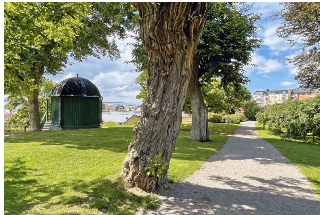
Alldeles vid kanten mot landborgsbranten står det Eppingska lusthuset, ursprungligen en del av den Henckelska trädgården. Utmed grusgången står äldre exemplar av robinia, äkta kastanj och hängask.