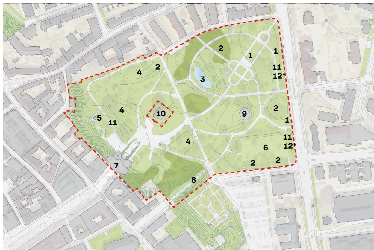
Parköversikt: Daniel Hoffing.

* Delar markerade med asterisk har inte bedömts vara av kulturhistoriskt värde men är av betydelse för upplevelse, estetik och/eller funktion.