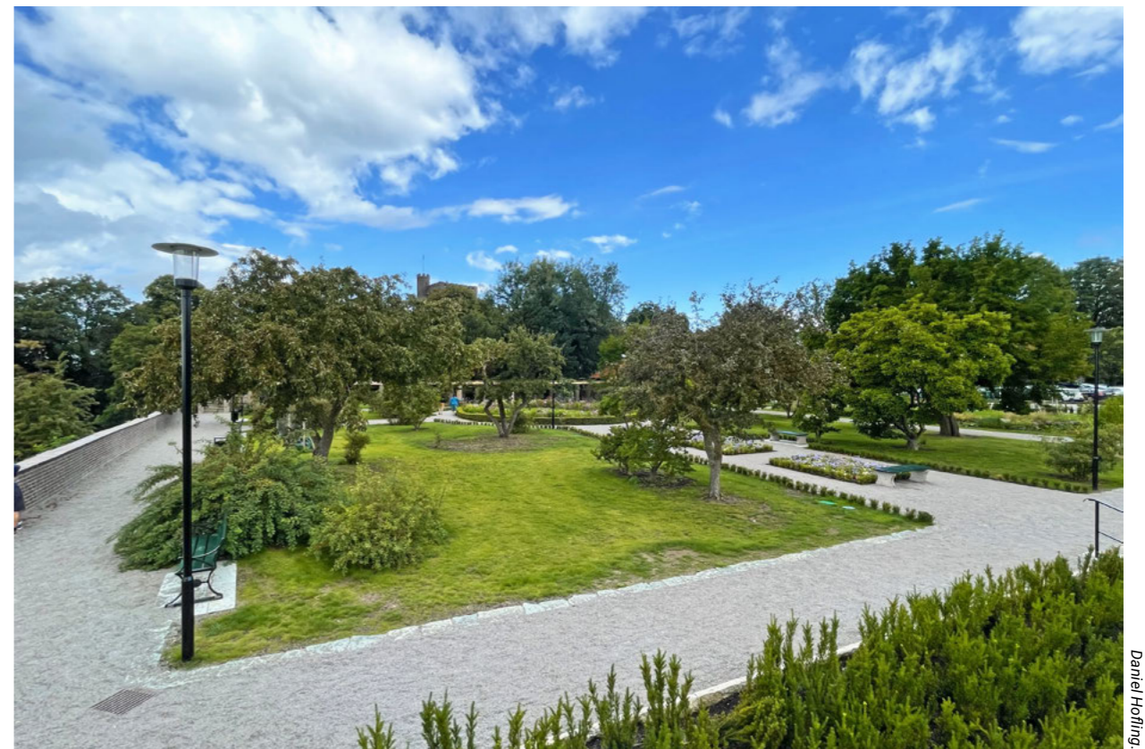
Rosenträdgården uppvisar en stram gestaltning med anspelning på medeltidens klosterträdgårdar. Buxbomskantade gräskvarter omges av grusade gångar som dels omger parken, dels är korslagda. Träden i kvarteren består främst av prydnadsaplar.

Under 1950-talets slut gjordes planteringarna om efter ritningar av landskapsarkitekten Sven-Ingvar Andersson. Rosornas antal minskades och de separerades i mindre ytor, väl avgränsade av låga