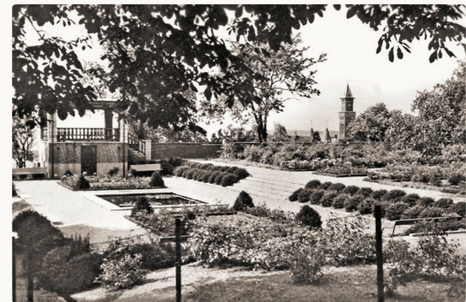
Vykort från 1940-talet som visar Rosenträdgårdens södra del. I den nedsänkta terrassen finns bassängen och bakom grenverket skymtar en av paviljongerna.

Rosenträdgården – som anlades i slutet av 1930-talet – ligger vid landborgens kant och bjuder på en fantastisk utsikt över staden och sundet. Det är en liten symmetriskt anlagd blomsterträdgård, där både medeltida klosterträdgårdar och barockens trädgårdar har inspirerat över tid. Parkens prydnadskaraktär och läge gör den till ett populärt besöksmål för både turister och stadens invånare.