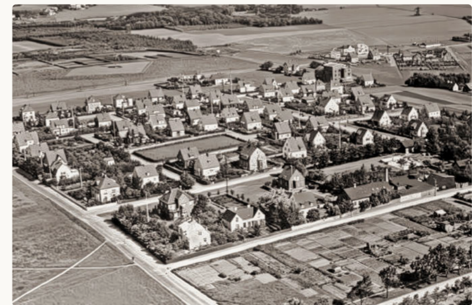
Flygfoto från 1932 över villabebyggelsen och den nyanlagda parken Fyrkanten i norra delen av Wilson park.

Fyrkanten är en utsökt liten pärla – ett grönt stadsrum som kompletterar kvartersstrukturen. Parken är uppbyggd av en öppen gräsmatta som omgärdas av avenbokshäckar och dubbla rader av arkadklippta avenbokar. Med sin strama och mycket enkla karaktär är Fyrkanten ett utsökt exempel på en park i 1920-talets klassicistiska ideal. Platsen används ofta av barnen i området för aktiviteter.