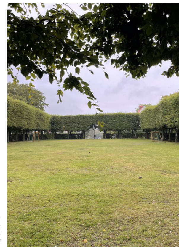
Fyrkanten har en enkel och symmetrisk uppbyggnad. Häckar och alléer av avenbok omger en rektangulär gräsmatta. I bildens mitt syns den välvda huvudentrén.