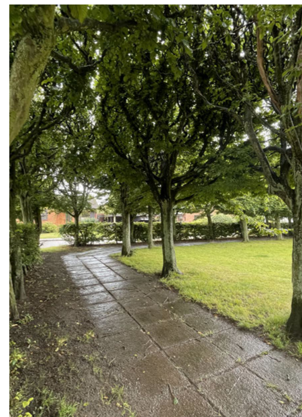
Under alléns krontak löper en gångväg belagd med betongplattor, tillkomna 1939.

Redan 1939 kompletterades parken med betongplattor i gångstigen, efter förslag av dåvarande stadsträdgårdsmästare Victor Anjou. Senare under 1900-talet ersattes de flyttbara parksofforna med fasta soffor utmed stigen. Det öppna gräsfältet har genom åren använts för aktiviteter.