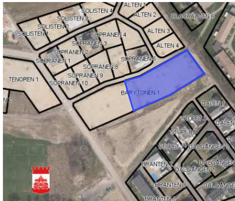
Läget för byggrätten