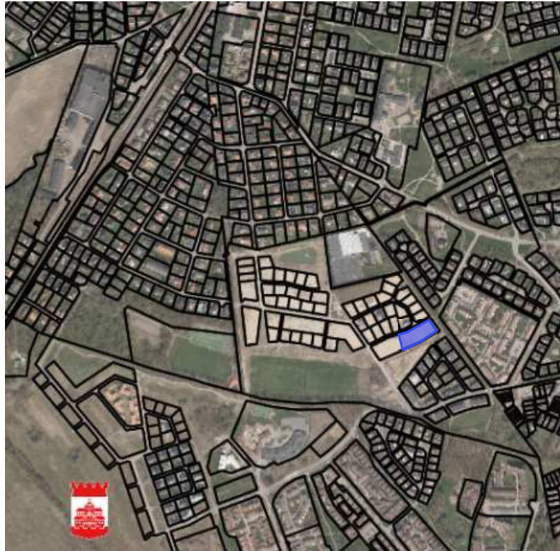
Läget i staden