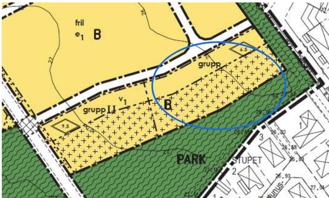
Utdrag ur plankartan

För området gäller detaljplan för fastigheten Ödåkra 4:23, Ödåkra, Helsingborgs stad , akt 1283K-17025. Planhandlingarna bifogas.