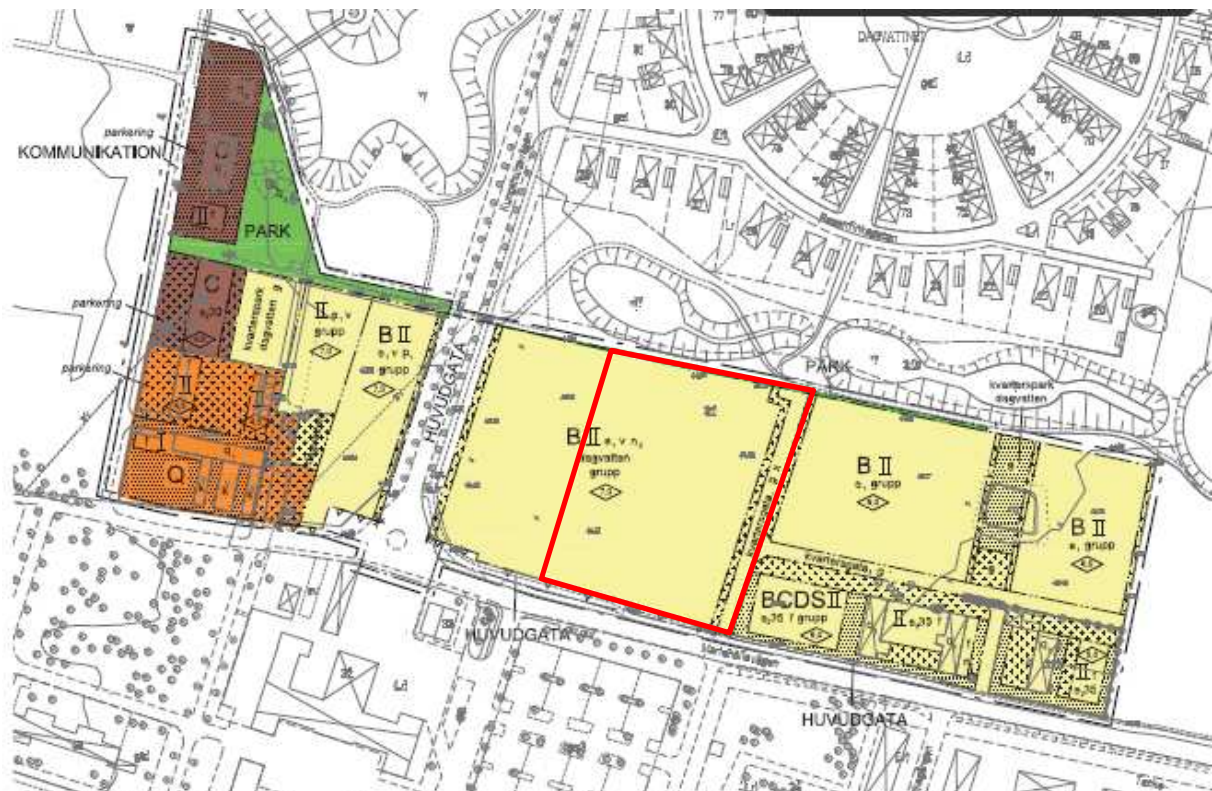
Utdrag ur plankartan (fastighetens ungefärliga läge och utbredning inom röd markering)

För området gäller detaljplan för del av fastigheten Pålsjö 3:1 m.fl, Mariehällsvägen, Mariastaden, Helsingborgs stad , akt 1283K-16692.