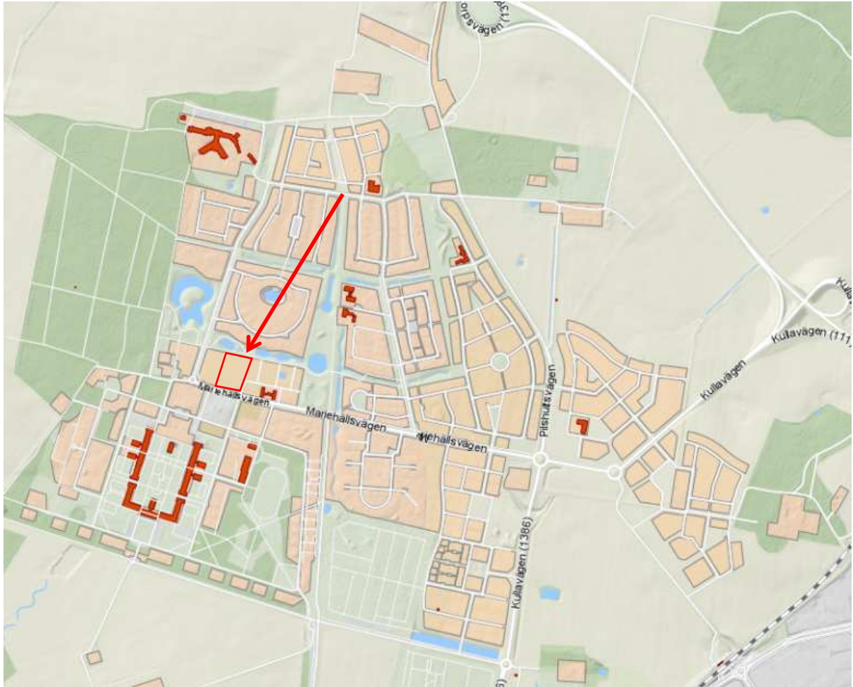
Läget i Mariastaden (fastighetens ungefärliga läge och utbredning inom röd markering)