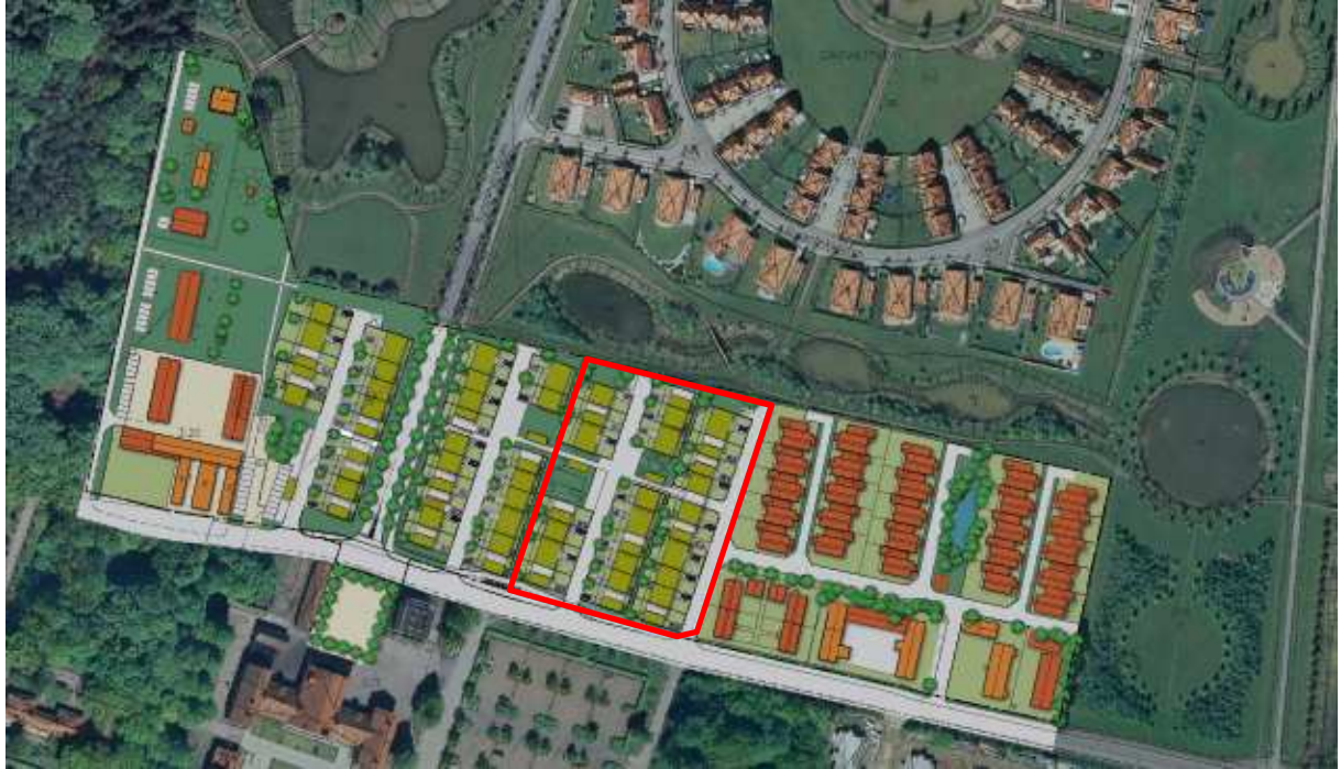
Illustration (fastighetens ungefärliga läge och utbredning inom röd markering)