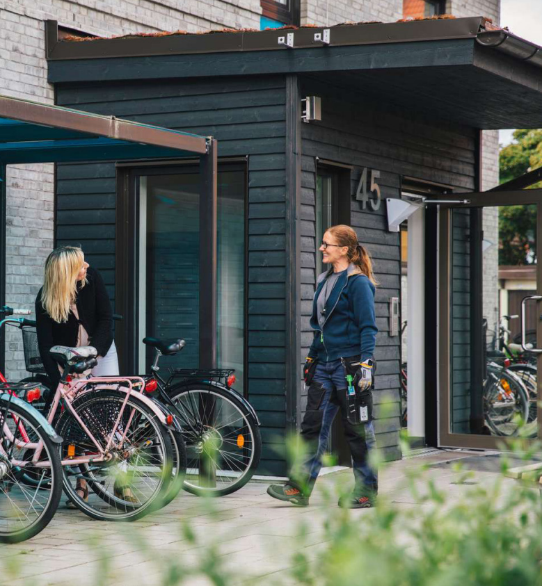
Ovan: Helsingborgshem använder lås med tag till cykelrummen. Mitten: Ett sätt att underlätta för cyklister är att erbjuda cykelpump.