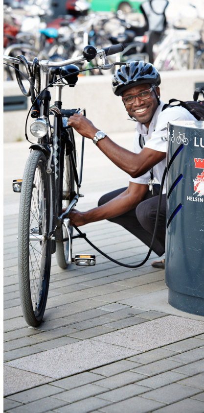
Till höger: Kv. Vélo, som Peab Bostad bygger i Dockan (Malmö), har cykelfokus, så både Peab Bostad och de boende kan bidra till ökad hållbarhet. (Vélo är franska och betyder cykel.)