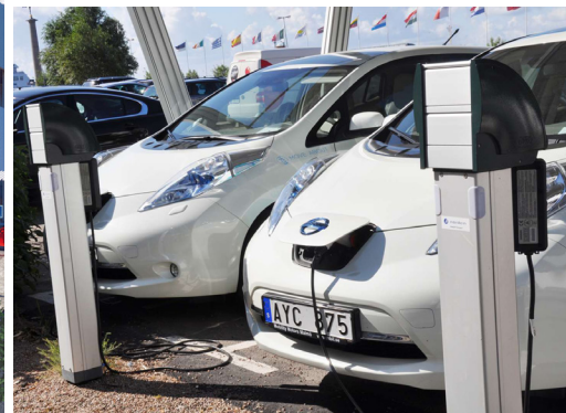
Ovan: I Helsingborg finns Moveabout elbilspool på ett flertal ställen.