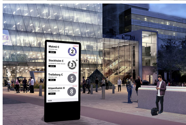
Lättillgänglig kommunikation om den närmaste kollektivtrafiken är alltid välkommen.