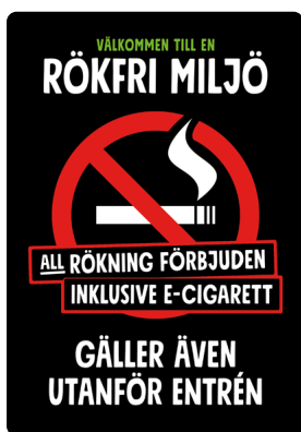
02B01 – Rött och vitt budskap mot svart bakgrund.