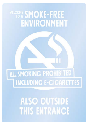
02A11 ENG – Vitt budskap mot transparent bakgrund.