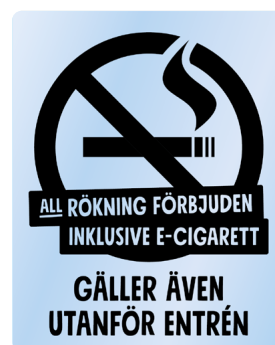
03B10 – Svart budskap mot transparent bakgrund.

Samtliga varianter av 03A och 03B samt 03A ENG och 03B ENG hittar du på webben: foretagare.helsingborg.se