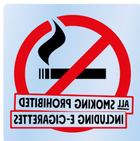
02A12 ENG – Spegelvänd rött och svart budskap mot transparent bakgrund.