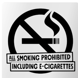
02A07 ENG – Infärgad aluminium med svart budskap