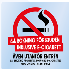
01B09 – Rött och svart budskap mot transparent bakgrund.