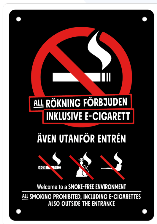
08A04 – Rött och vitt budskap mot svart bakgrund.