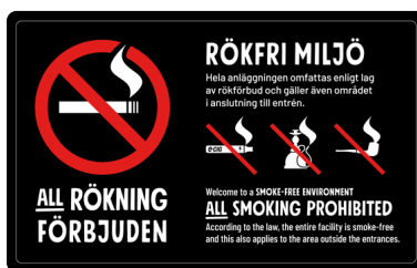
07A04 – Rött och vitt budskap mot svart bakgrund