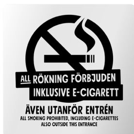
01B07 – Infärgad aluminiumplatta med svart budskap.