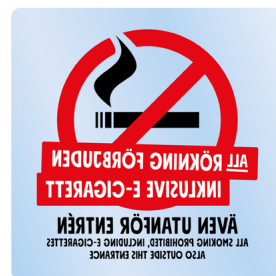
01B12 – Spegelvänt rött och svart budskap mot transparent bakgrund.