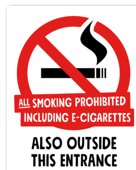
03B03 ENG – Rött och svart budskap mot vit bakgrund