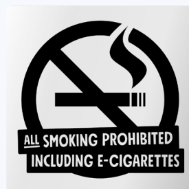
02B07 ENG – Infärgad aluminium med svart budskap.