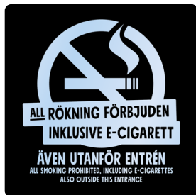
01B15 – Transparent budskap mot bakgrund i valfri PMS C.