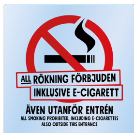
01A09 – Rött och svart budskap mot transparent bakgrund.