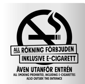
01A07 – Infärgad aluminiumplatta med svart budskap.