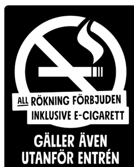
03B05 – Vitt budskap mot svart bakgrund