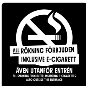
01B05 – Vitt budskap mot svart bakgrund.