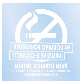
01A14 – Spegelvänt vitt budskap mot transparent bakgrund.