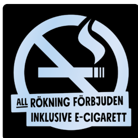
02B15 – Transparent budskap mot bakgrund i valfri PMS C.