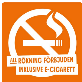
02B08 – Vitt eller svart budskap mot bakgrund i valfri PMS C.