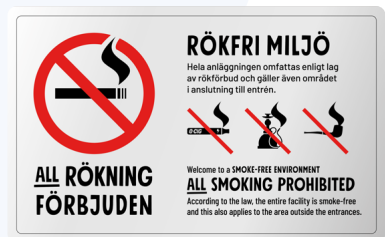
07A06 – Infärgad aluminium med rött och svart budskap.