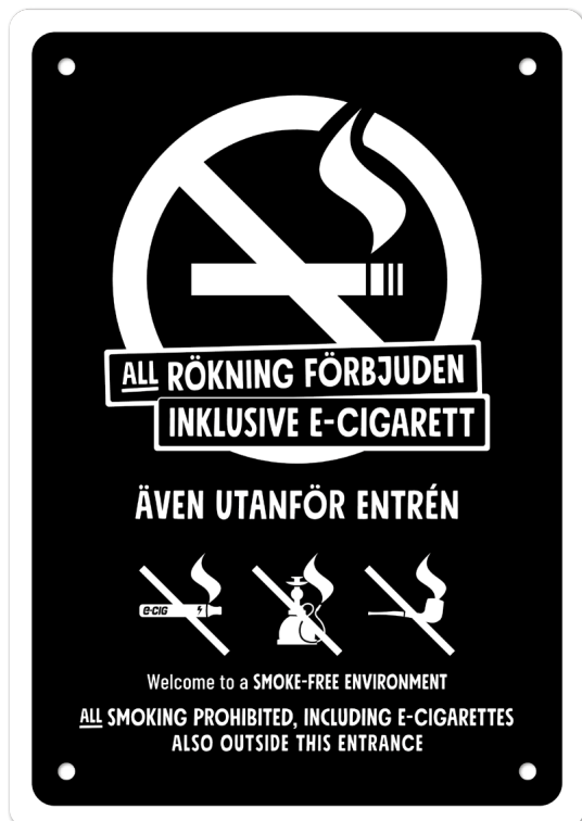
08A05 – Vitt budskap mot svart bakgrund.

08A finns att ladda ned som tryckoriginal på: foretagare.helsingborg.se