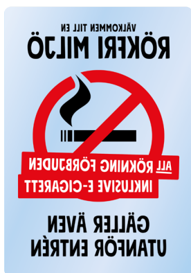
02B12 – Spegelvänd rött och svart budskap mot transparent bakgrund.

Samtliga varianter av 04A och 04B samt 04A ENG och 04B ENG hittar du på webben: foretagare.helsingborg.se