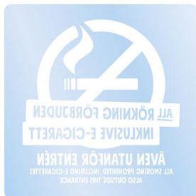
01B14 – Spegelvänt vitt budskap mot transparent bakgrund.