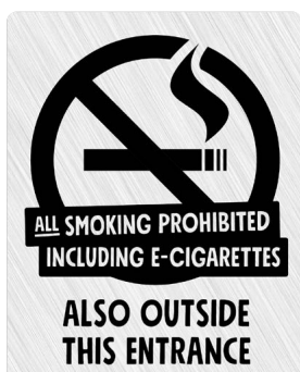
03B02 ENG – Svart budskap mot ljusgrå aluminiumliknande bakgrund