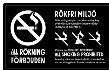
07A05 – Vitt budskap mot bakgrund.