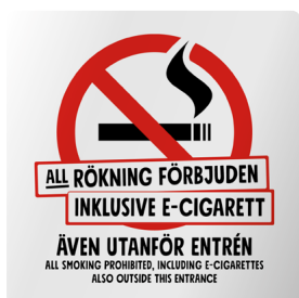
01A06 – Infärgad aluminiumplatta med rött och svart budskap.