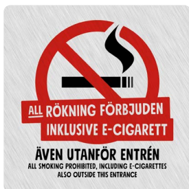
01B01 – Rött och svart budskap mot ljusgrå aluminiumliknande bakgrund.