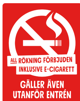
03B08 – Vitt eller svart budskap mot bakgrund i valfri PMS C.