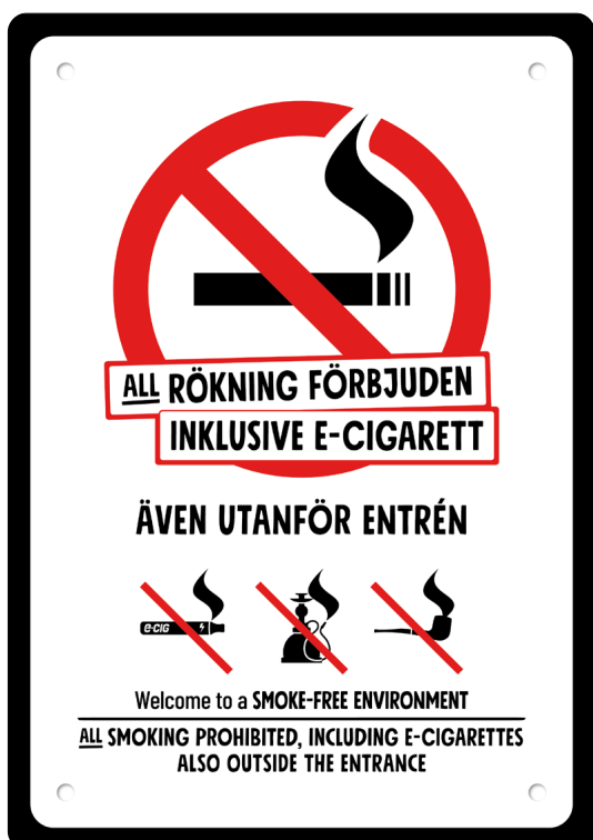
08A03 – Rött och svart budskap mot vit bakgrund.