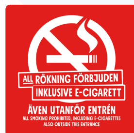
01A08 – Vitt eller svart budskap mot bakgrund i valfri PMS C.