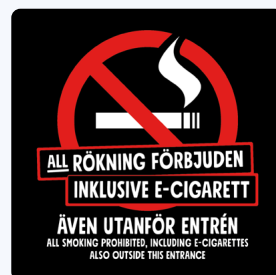
01A04 – Rött och vitt budskap mot svart bakgrund.