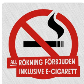
02B01 – Rött och svart budskap mot ljusgrå aluminiumliknande bakgrund.