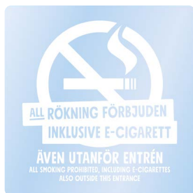
01B11 – Vitt budskap mot transparent bakgrund.