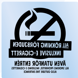
01B13 – Spegelvänt svart budskap mot transparent bakgrund.