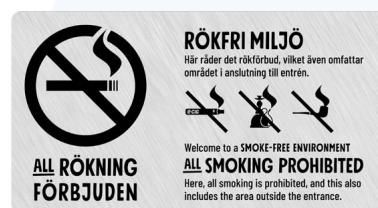
06A02 – Svart budskap mot ljusgrå aluminiumliknande bakgrund.

06A finns att ladda ned som tryckoriginal på: foretagare.helsingborg.se