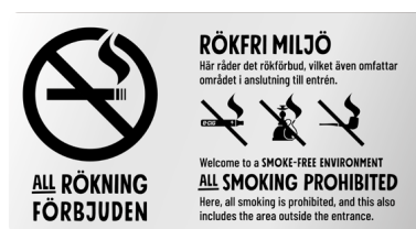
06A07 – Infärgad aluminium med svart budskap.