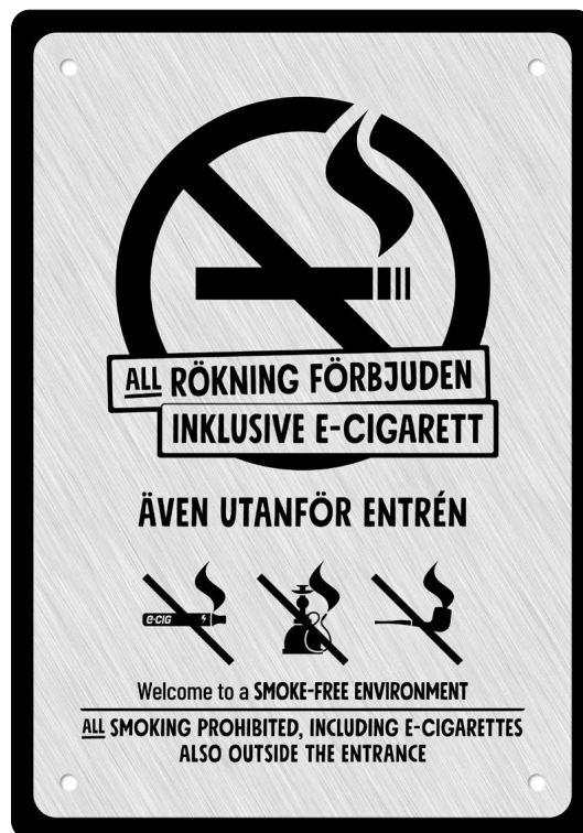
02A02 – Svart budskap mot ljusgrå aluminiumliknande bakgrund.