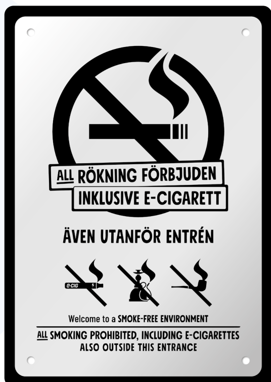
08A07 – Infärgad aluminiumplatta med svart budskap.