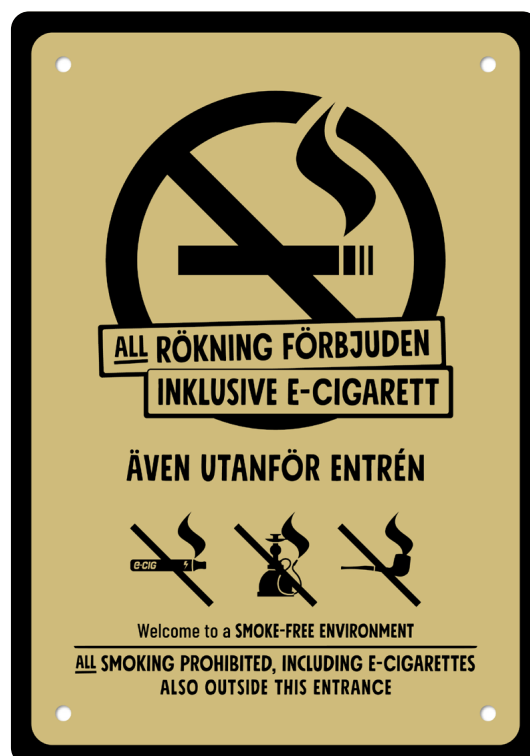
08A08 – Svart eller vitt budskap mot bakgrund i valfri PMS C.