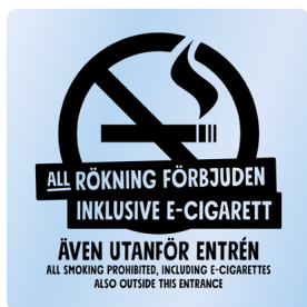
01B10 – Svart budskap mot transparent bakgrund.