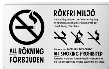
07A07 – Infärgad aluminium med svart budskap.