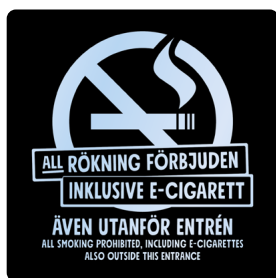
01A15 – Transparent budskap mot bakgrund i valfri PMS C.