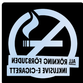
02B16 – Spegelvänd, transparent budskap mot bakgrund i valfri PMS C.

Samtliga varianter av 02A och 02B samt 02A ENG och 02B ENG hittar du på webben: foretagare.helsingborg.se