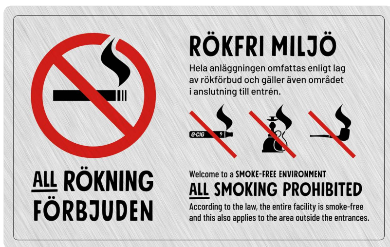
07A01 – Rött och svart budskap mot ljusgrå aluminiumliknande bakgrund.

07A finns att ladda ned som tryckoriginal på: foretagare.helsingborg.se