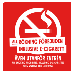
01B08 – Vitt eller svart budskap mot bakgrund i valfri PMS C.