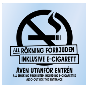
01A10 – Svart budskap mot transparent bakgrund.