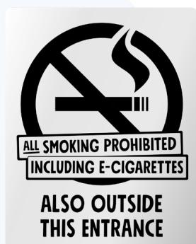
03A07 ENG – Infärgad aluminium med svart budskap.