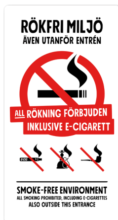
05B03 – Rött och svart budskap mot vit bakgrund

Samtliga varianter av 05A och 05B hittar du på webben: foretagare.helsingborg.se