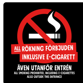
01B04 – Rött och vitt budskap mot svart bakgrund.