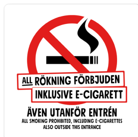
01A03 – Rött och svart budskap mot vit bakgrund.