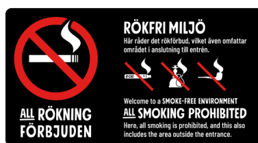
06A04 – Rött och vitt budskap mot svart bakgrund