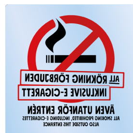
01A12 – Spegelvänt rött och svart budskap mot transparent bakgrund.