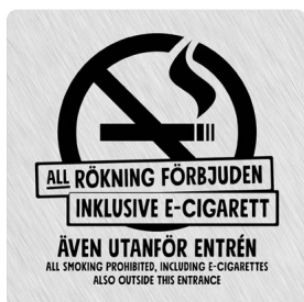
01A02 – Svart budskap mot ljusgrå aluminiumliknande bakgrund.