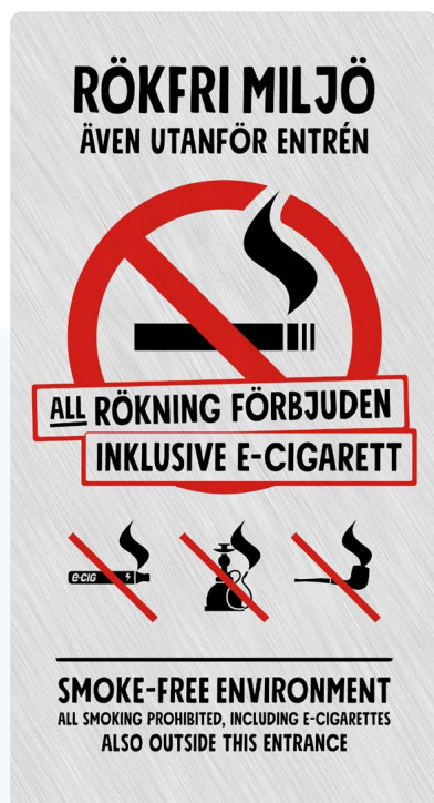
05A01 – Rött och svart budskap mot ljusgrå aluminiumliknande bakgrund.

Samtliga varianter av 05A och 05B hittar du på webben: foretagare.helsingborg.se