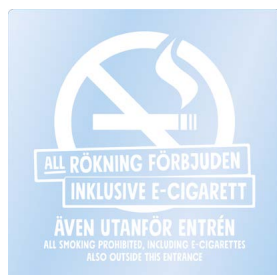
01A11 – Vitt budskap mot transparent bakgrund.