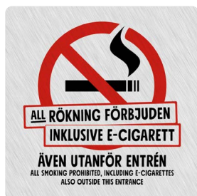
01A01 – Rött och svart budskap mot ljusgrå aluminiumliknande bakgrund.