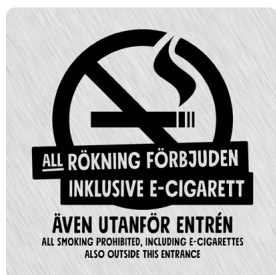
01B02 – Svart budskap mot ljusgrå aluminiumliknande bakgrund.