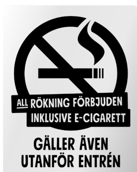
03B07 – Infärgad aluminium med svart budskap.