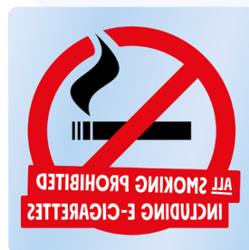
02B12 ENG – Spegelvänd rött-svart-vitt budskap mot transparent bakgrund.