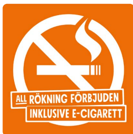
02A08 – Vitt eller svart budskap mot bakgrund i valfri PMS C.