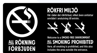
06A05 – Vitt budskap mot bakgrund.