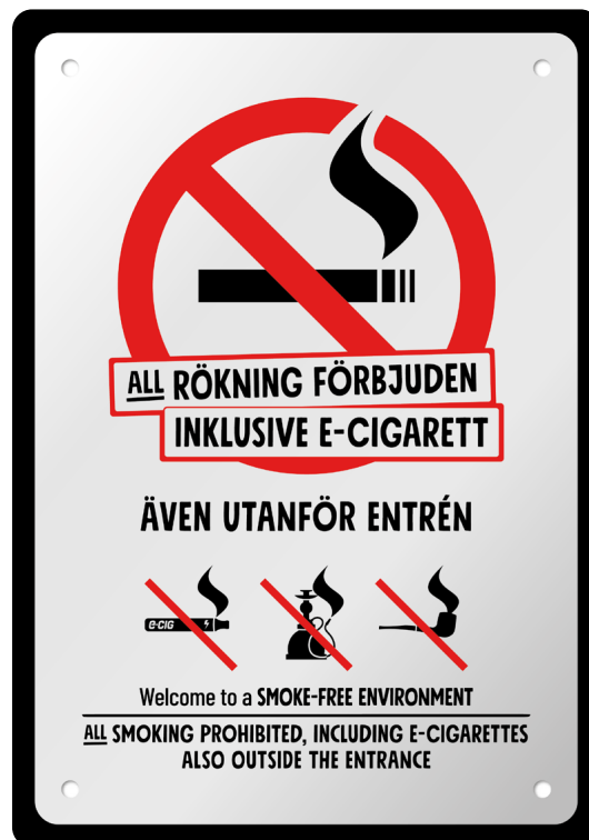
08A06 – Infärgad aluminiumplatta med rött och svart budskap.