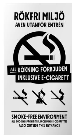
05B07 – Infärgad aluminium med svart budskap.