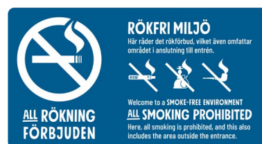
06A08 – Vitt eller svart budskap mot bakgrund i valfri PMS.