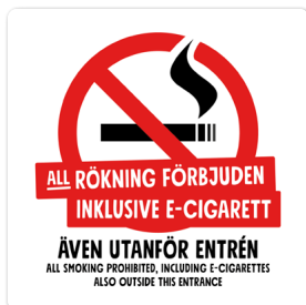
01B03 – Rött och svart budskap mot vit bakgrund.