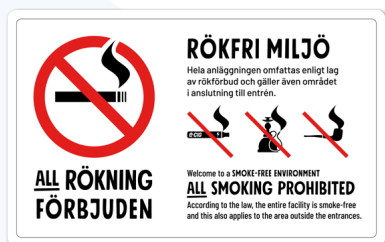
07A03 – Rött och svart budskap mot vit bakgrund.