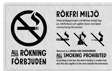
07A02 – Svart budskap mot ljusgrå aluminiumliknande bakgrund.

07A finns att ladda ned som tryckoriginal på: foretagare.helsingborg.se