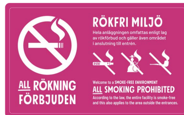
07A08 – Vitt eller svart budskap mot bakgrund i valfri PMS.