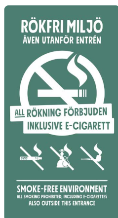
05B08 – Vitt eller svart budskap mot bakgrund i valfri PMS.