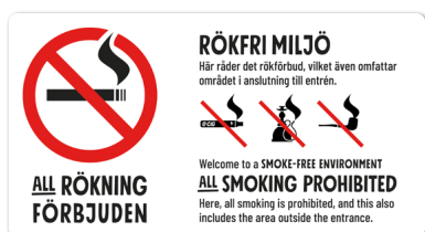
06A03 – Rött och svart budskap mot vit bakgrund.