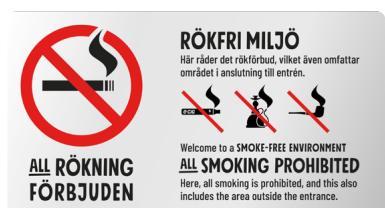
06A06 – Infärgad aluminium med rött och svart budskap.