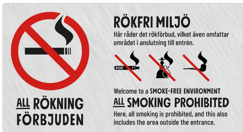
06A01 – Rött och svart budskap mot ljusgrå aluminiumliknande bakgrund.

06A finns att ladda ned som tryckoriginal på: foretagare.helsingborg.se