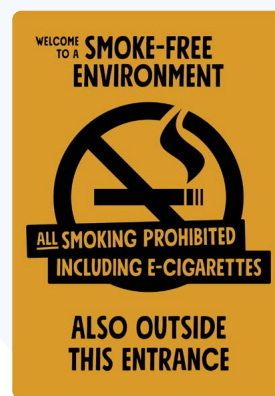
02B08 ENG – Svart eller vitt budskap mot bakgrund i valfri PMS C.