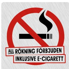
02A01 – Rött och svart budskap mot ljusgrå aluminiumliknande bakgrund.