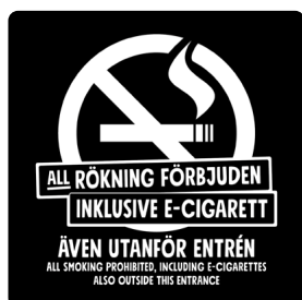
01A05 – Vitt budskap mot svart bakgrund.