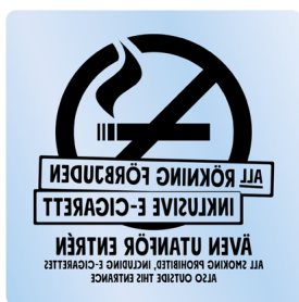
01A13 – Spegelvänt svart budskap mot transparent bakgrund.