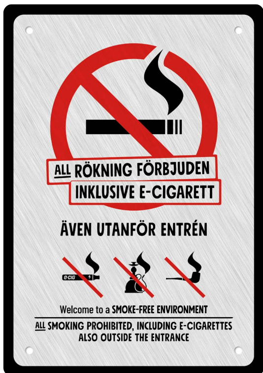
08A01 – Rött och svart budskap mot ljusgrå aluminiumliknande bakgrund.

Här visas de åtta olika varianter av 08A som du kan välja av rektangulär fasadskylt med måtten 280 x 285 millimeter och som kan anpassas proportionerligt till valfri bredd eller höjd.