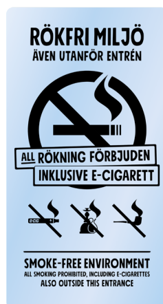
05A10 – Svart budskap mot transparent bakgrund.