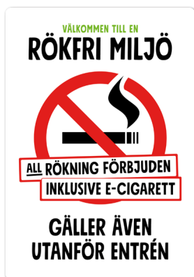
04A03 – Rött och svart budskap mot vit bakgrund.