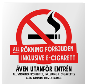
01B06 – Infärgad aluminiumplatta med rött och svart budskap.