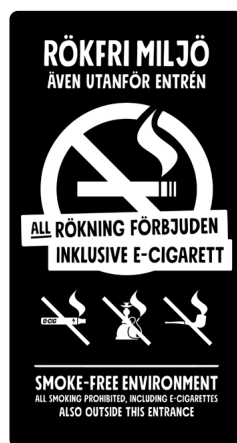
05B05 – Vitt budskap mot svart bakgrund.