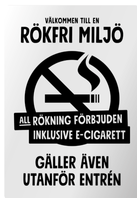
02A07 – Infärgad aluminium med svart budskap.