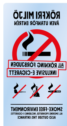
05B12 – Spegelvänt rött och svart budskap mot transparent bakgrund.