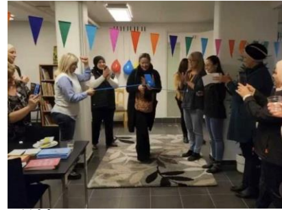
Bild från invigningen

Vår lokal på Fredriksdal invigdes i januari och sedan dess har verksamheten med lästräning varit i full gång. I lokalen bedrivs också vårt ytterligare föräldrastöd i form av ett språkcafé där ledare och föräldrar diskuterar skolrelaterade ämne, och deltagarna får möjlighet till individuell lästräning. Lokalen delar vi med Stadsdelsmammor.