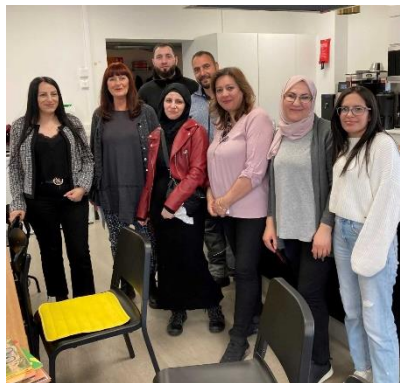
Bild från avslutningen

Från hösten 2022 till våren 2023 har Familjen läsers första föräldracirkel genomförts på @Plantan, i samarbete med Studiefremjandet. Under tio träffar har föräldrar till 5-åringar lärt sig och diskuterat ämnen som gjort dem mer redo inför deras barns kommande skolstart. Föräldrarna har också fått tips om resurser som de kunnat använda för att träna läsning hemma med sina barn. Det har också erbjudits barnverksamhet under föräldracirkelns tider.