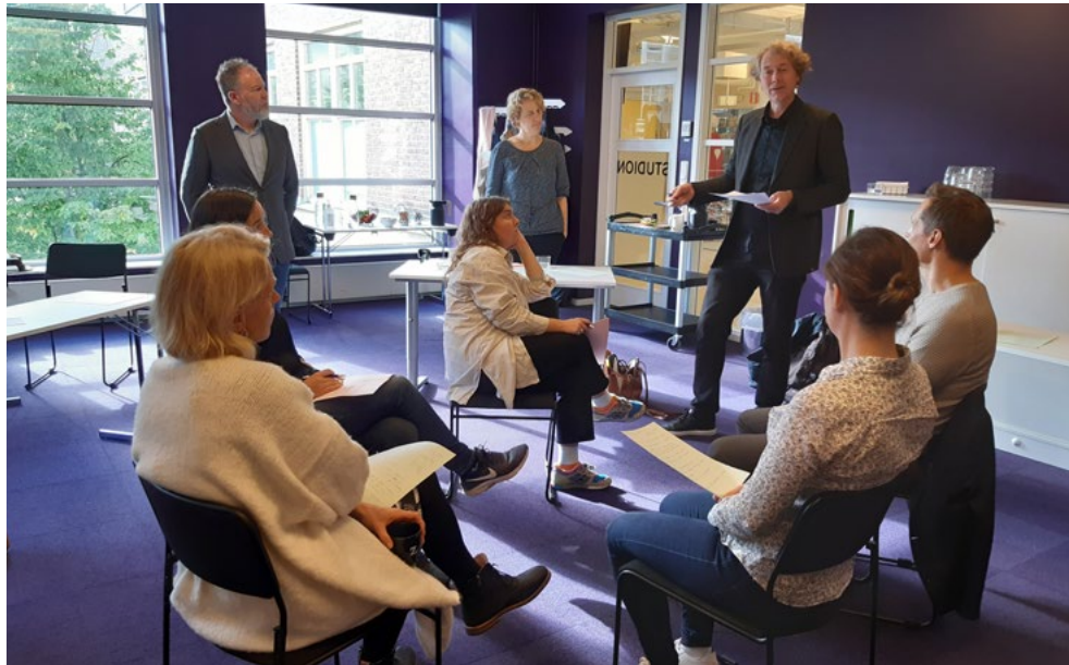
Bild 4.1 Labbets arbetsgrupp har möte.