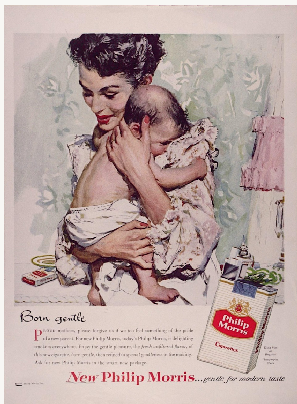
Philip Morris. Born Gentle New Philip Morris...gentle for modern taste. 1956.

I flera år erbjöd Philip Morris kampanjer för sina Virginia Slims-cigarett, inklusive "V wear"-kataloger med blusar, kappor, halsdukar och accessoarer i utbyte mot att köpa paket med Virginia Slims-cigarett. 2008 introducerade de sina miniförpackningar "Super Slims Ultra Lights" – som såldes i eleganta och kompakta förpackningar, ungefär hälften så stora som ett vanligt cigarettpaket. Idag hittar vi liknande paket för vejpning av både nikotin och cannabis och som kan jämföras med förpackningen för ett läppstift eller en mascara och får plats i fickan.