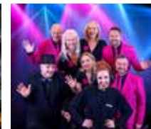
Helsingborgsrevyn är tillbaka nästa år, efter påtvingat pandemiuppehåll.

– Det händer mycket spännande på Kullagatan. Magnus Stenbock-gallerian